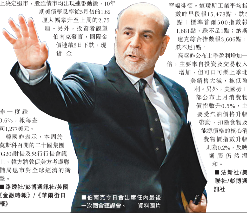
伯南克今日會出席任內最後一次國會聽證會。資料圖片