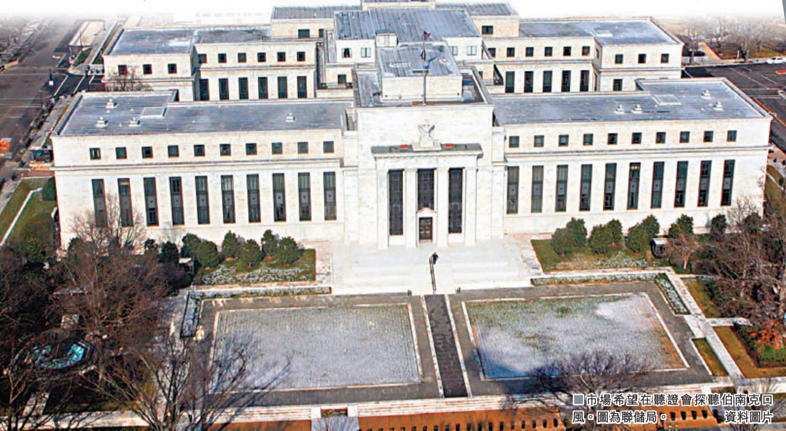
市場希望在聽證會探聽伯南克回風。圖為聯儲局。

假如美國聯邦儲備局主席伯南克明年不連任，今明兩日出席的國會聽證會將是他任內最後一次，市場嚴陣以待，希望從其發言探聽量寬鬆(QE)政策的前景。根據事先準備的證詞，伯南克將重申退市決定與息口調升並不掛鉤，市場不應混為一談。不過，若他進一步詳述局方將於何時減少購債，料將觸動市場神經。