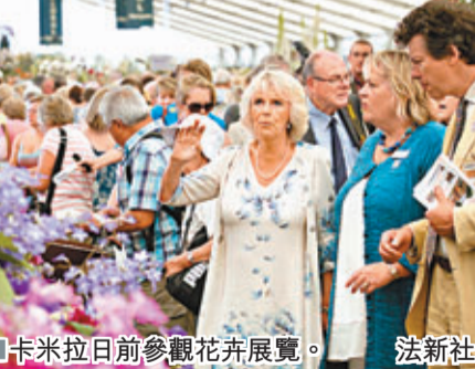
卡米拉日前參觀花卉展覽。