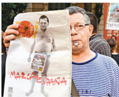
示威者抗議拉霍伊接受黑金。

西班牙首相拉霍伊近日捲入非法政治獻金醜聞，執政人民黨前司庫巴爾塞尼亞向法庭聲稱，拉霍伊在2008年至2010年間曾接受非法政治獻金。拉霍伊堅決否認，並拒絕辭職。輿論憂慮西國政局不穩會令歐債風險再升溫。