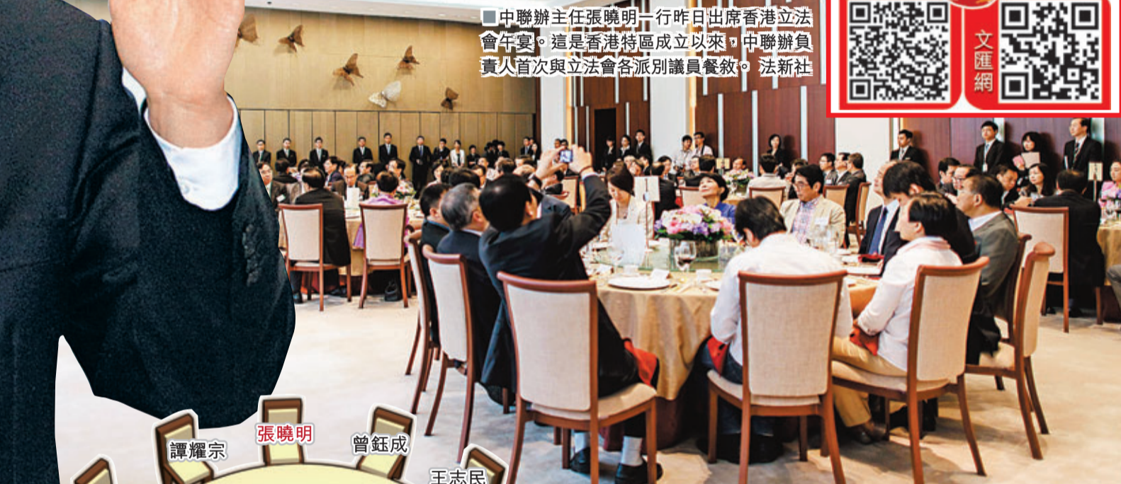
中聯辦主任張曉明一行昨日出席香港立法會午宴。這是香港特區成立以來，中聯辦負責人首次與立法會各派別議員餐敘。

香港文匯報訊（記者 鄭治祖）中聯辦主任張曉明昨日歷史性地到立法會與全體議員共進午宴。他在致辭中提出3點願望，主動提到備受關注的政制發展問題，強調中央對香港實現普選的立場和誠意是不容懷疑的，但必須符合《基本法》和全國人大常委會相關決定，而不能走彎路，並特別提出設計普選制度時其中一個重要原則，即必須處理好與中央關係，保障國家主權、安全和中央依法享有的權力。他並以16字真言與立法會議員共勉，「相互尊重、求同存異、理性溝通、良性互動」。