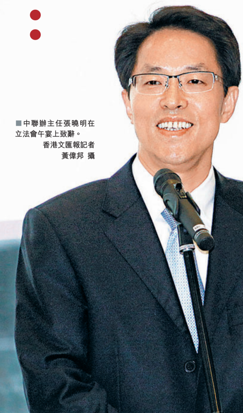
中聯辦主任張曉明在立會午宴上致辭。