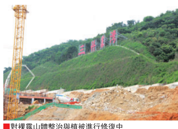
對裸露山體整治與植被進行修復中