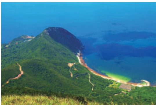
深圳大鵬魅力海灣