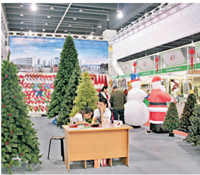
義烏市場的聖誕禮品又將迎來銷售旺季。

截至目前，義烏共有各類市場主體超19萬戶，其中「市場採購」新型貿易企業已登記成立322家，註冊資本總