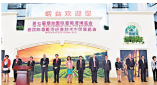
第七屆煙台國際葡萄酒博覽會開幕。