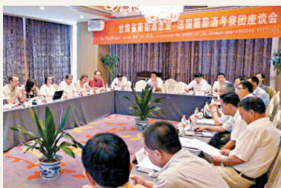
法國葡萄酒專家與甘肅葡萄酒企業高管交流。