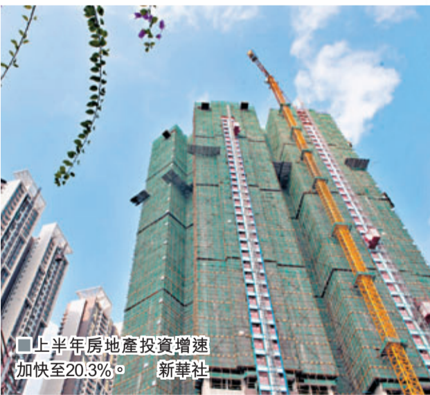
上半年房地產投資增速加快至20.3%。

房地產開發企業到位資金情況，上半年房地產開發企業到位資金57,225億元，同比增長32.1%，增速比一季度加快2.8個百分點，比上年同期加快26.4個百分點。