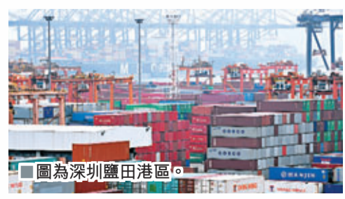
圖為深圳鹽田港區。

據海關統計，今年1-6月廣東省外貿進出口總值為5,544.1億美元，扣除匯率因素同比增長21.2%，比1-5月回落5.7個百分點，較前4月更回落15個百分點。單6月，廣東外貿進、出口繼續呈降勢，進出口總值788.6億美元，扣除匯率因素下降4.5%，同期全國下降2%，其