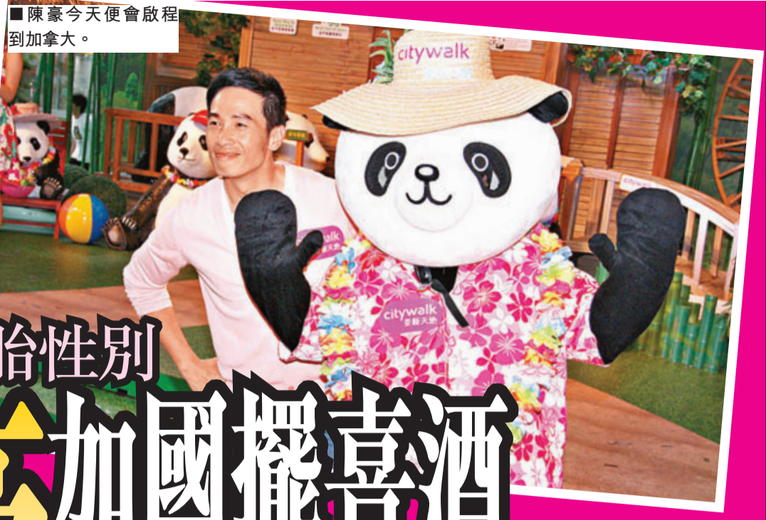
陳豪今天便會啟程到加拿大。

香港文匯報訊 (記者 吳文釗) 雙喜臨門的陳豪昨日出席「關愛·大熊貓2013」活動時透露，今天中午便會啟程到加拿大，與太太陳茵媺 (Aimee) 準備補擺喜酒。一向喜歡低調行事的陳豪表示只宴請雙方家長及親友，圈中朋友待他回港後再逐一補吃飯慶祝，也不打算在港補擺喜酒。