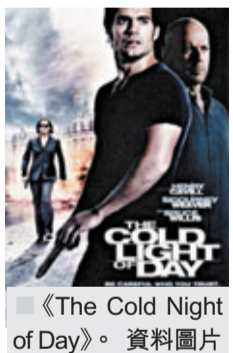
《The Cold Light of Day》。資料圖片

電影《The Cold Light of Day》(2012) 中的主角與家人前往海邊度假，家人突然失蹤，其後發現全遭綁架。他經過一連串的追查後才發現，原來自己父親隱藏着上半生一個重大的秘密，背後還有一個重大陰謀。同類的作品還有《機密邂逅》(The Tourist)，電影由安祖蓮娜·祖莉和尊尼·特普主演。故事由一個本來平凡的假期開始，結果被反追蹤和監視，甚至發生連場追殺。