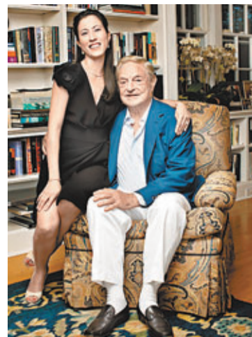
索羅斯與多美子去年發布在英國住所內的合照。資料圖片