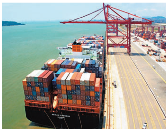
深圳港上半年集裝箱吞吐量增長2.5%。

香港文匯報訊（記者 李昌鴻、實習記者 周瀟 深圳報道）根據深圳市交委資料，受掛靠大船持續增加和海鐵聯運上升等影響，今年上半年，深圳港全港累計完成貨物吞吐量超過11,562萬噸，同比增長4.51%。集裝箱吞吐量1,106.02萬標箱，同比增長超過2.5%。