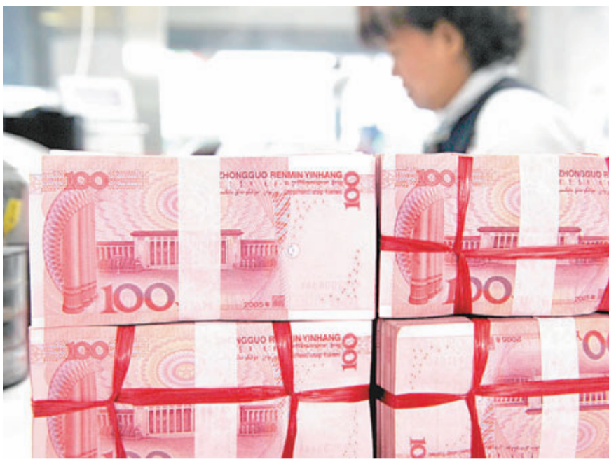
6月廣義貨幣供應量(M2)同比增長14%，創今年新低。資料圖片

另外，央行同日公布，6月新增人民幣貸款8,605億元，高於市場預期的8,000億元。6月底人民幣貸款餘額68.08萬億元，同比增長14.2%。