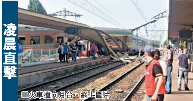
■火車撞向月台。網上圖片

法國巴黎南部昨日有一列載滿乘客的火車出軌，當地傳媒指最少造成8人死亡，數十人傷。事發於昨日傍晚繁忙時間，報道指火車上載有約350人，當時正駛向巴黎南部一個火車站，目擊者指火車以高速駛進車站，之後突然一分為二，前一截撞向月台，據報有4節車廂撞在一起，後一截則停在軌道上。