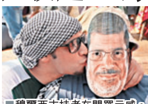
■穆爾西支持者在開羅示威。

埃及局勢未穩，美軍於近日將部署中東的兩艘戰艦，調往埃及紅海沿海戒備，軍方回應時指，此舉是以防發生事件時，可更容易派出直升機或其他裝備。報道指，美軍經常派戰艦到局勢混亂地區的周邊水域，以備撤僑或人道救援工作，但不代表將採取軍事行動。