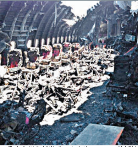
■肇事客機內部變成一片廢墟。