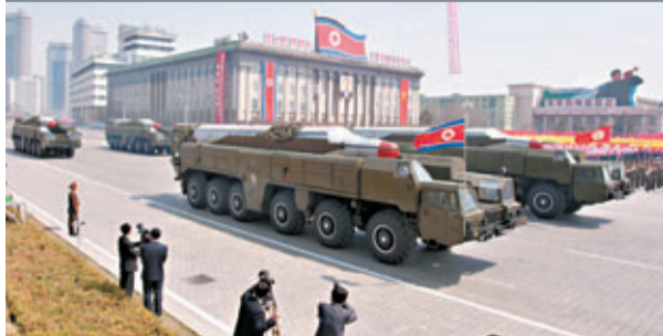
■韓媒稱朝鮮軍事巡遊排練中有「舞水端」導彈。圖為去年閱兵。資料圖片

朝鮮據報月底將在平壤舉行閱兵式，韓聯社指，從朝方為排練而動員的裝備和兵力規模判斷，此次閱兵的規模將是歷屆之最，並可能公開搭載核彈頭的新型導彈。報道引述韓國政府消息稱，朝鮮在平壤美林機場進行