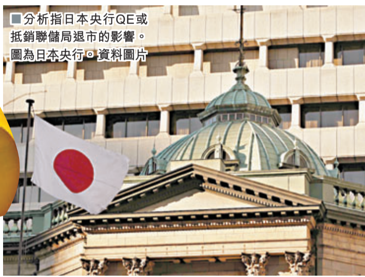
■分析指日本央行QE或抵銷聯儲局退市的影響。圖為日本央行。