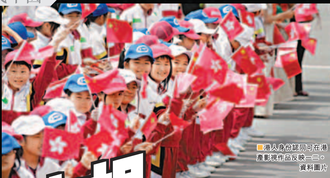
港人身份認同可在港產影視作品反映一三。資料圖片