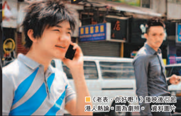
《老表，你好嘢！》播映後引起港人熱論。圖為劇照。

香港新聞學者馬傑偉在《影視香港—身份認同的時代變奏》一書指出：「對香港居民來說，內地新移民的負面形象卻成了肯定自己身份的文化資源。」上世紀70年代後期，大眾文化的普及和發展，李小龍、狄龍等明星消費及二戰後土生土長的嬰兒潮一代逐漸成為社會主力等因素，都構建以香港自我為價值判斷的自我意識。與物質豐富、進退得體的港人來說，這些在影視中被異化行為的內地人則處於極端劣勢。有人認為，從他們身上，港人可輕易獲得強烈文化優越感，也能感受到對集體虛榮的滿足。