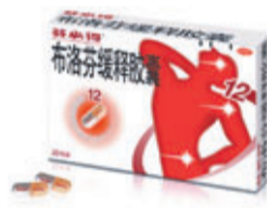
■葛蘭素史克藥廠生產的素史克(中國)投資有限公司芬必得。網上圖片

香港文匯報訊 據中新社報道，公安部昨日在北京發佈消息稱，因涉嫌嚴重經濟犯罪，葛蘭素史克(中國)投資有限公司部分高管被警方立案偵查。警方查明，作為大型跨國藥企，近年來葛蘭素史克(中國)投資有限公司芬必得，在華經營期間，為達到打開藥品銷售渠道、提高藥品售價等目的，利用旅行社等渠道，採取直接行賄或贊助項目等形式，向個別政府部門官員、少數醫藥行業協會和基金會、醫院、醫生等大肆行賄。