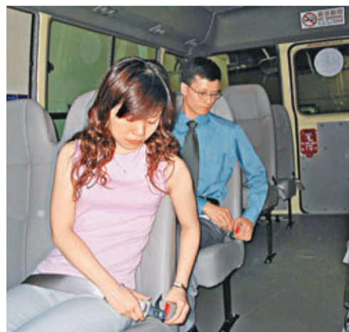
儘管當局宣傳、警務處執法,但仍有91%公共小巴乘客沒有配戴安全帶。資料圖片