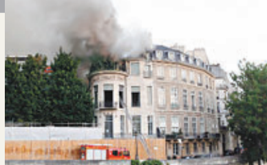
■大宅起火並冒出濃煙。

事發於前日凌晨，豪宅屋頂突然起火，140名消防員到場撲救，但由於單位空置和正在裝修，火勢迅速蔓延，約6小時後才受控。消防員泰斯蒂表示，由於豪宅結構脆弱，增加撲救難度。當局將檢查豪宅結構有否受損，亦會點算屋內藝術品情況。起火豪宅被視為17世紀中期法國建築的代表作，於1640年建成，是塞納