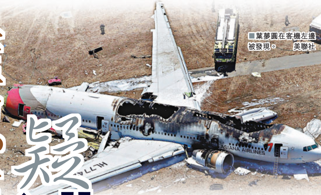
■葉夢圓在客機左邊被發現。