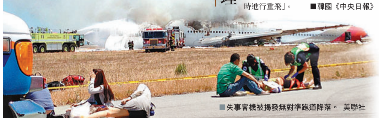
■失事客機被揭發無對準跑道降落。