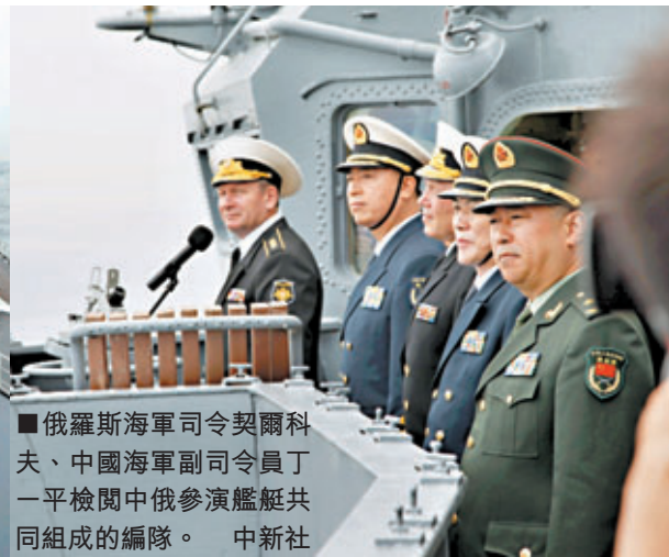
俄羅斯海軍司令契爾科夫、中國海軍副司令丁一平檢閱中俄參演艦艇共同組成的編隊。