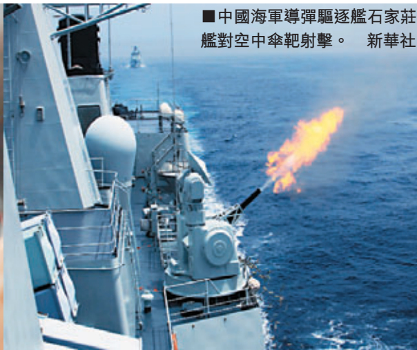
中國海軍導彈驅逐艦石家莊艦對空中傘靶射擊。