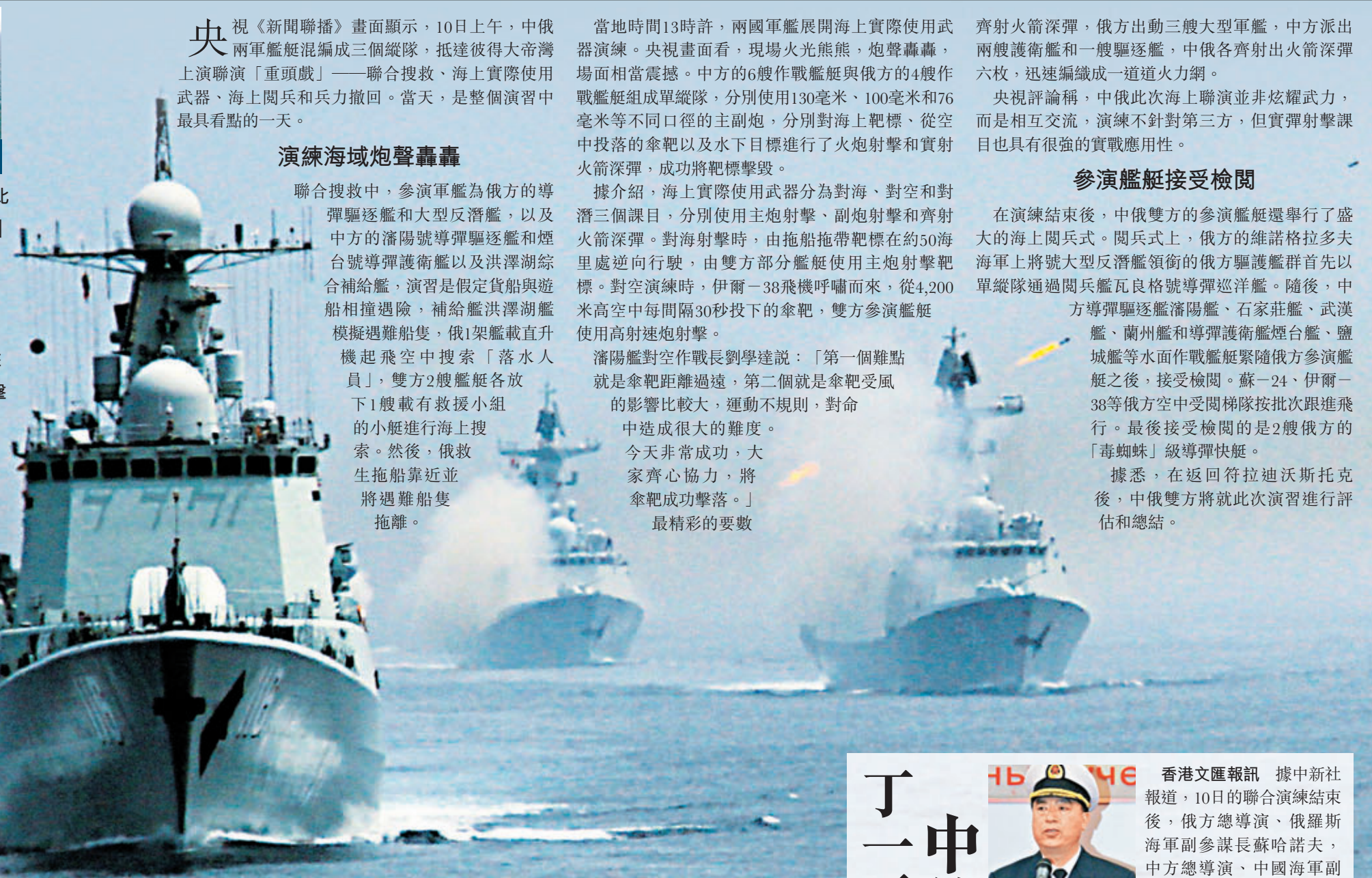
中國海軍參演軍艦發射反潛火箭深彈。新華社

香港文匯報訊 (記者 葛沖 北京報導)「海上協作—2013」中俄海上聯合軍演10日達到高潮，中俄雙方都拿出真本事了！在波濤澎湃的日本海彼得大帝灣，中俄軍艦精彩射擊火炮和實射火箭深彈，成功擊毀海上靶標、從空中投落的傘靶以及水下目標。之後，中俄雙方的參演艦艇還舉行了盛大的海上閱兵式。至此，中俄海上聯合軍演實兵演練完美收官。