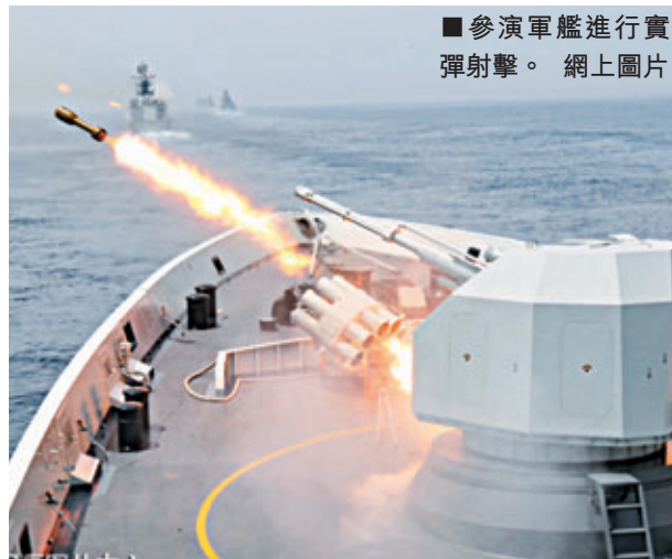
參演軍艦進行實彈射擊。