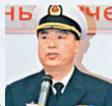
中國海軍副司令員丁一平。資料圖片

香港文匯報訊 據中新社報導，10日的聯合演練結束後，俄方總導演、俄羅斯海軍副參謀長蘇哈諾夫，中方總導演、中國海軍副司令員丁一平在金門灣碼頭共同會見記者。丁一平強調，此次軍演為中俄兩軍，尤其是兩國海軍全面合作進一步奠定了基礎，兩國海軍的聯合演習將常態化、機制化。