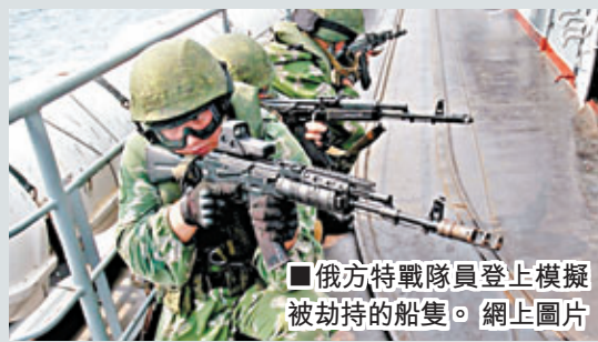
俄方特戰隊員登上模擬被劫持的船隻。

9日中俄軍演重點科目是兩國特戰隊聯合進行反海盜演習，兩國海軍將在最接近實戰條件下，共同解救被劫持的船隻，並抓獲「海盜」。特種分隊從空中和海上登上甲板解救人員，裝備精良，行動敏捷的俄特種部隊由此曝光。