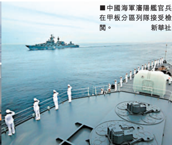
中國海軍瀋陽艦官兵在甲板分區列隊接受檢閱。