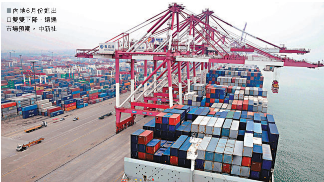
■內地6月份進出口雙雙下降，遠遜市場預期。

香港文匯報訊(記者 劉坤領 北京報道) 內地外貿呈現逐步回落態勢。據海關總署昨日發佈的數據顯示，今年上半年，中國進出口總值錄得12.51萬億元，同比增長8.6%。其中，6月當月外貿表現低迷，17個月來進出口首次呈現負增長，出口更是大降3.1%，創44個月新低；中日中歐主要市場仍處下降通道。海關總署指出，受外需低迷、人民幣持續升值、用工成本上升等因素作用，下半年外貿形勢面臨諸多困難，三季度出口不容樂觀。另外，專家擔憂，全年外貿增長「保八」形勢嚴峻。