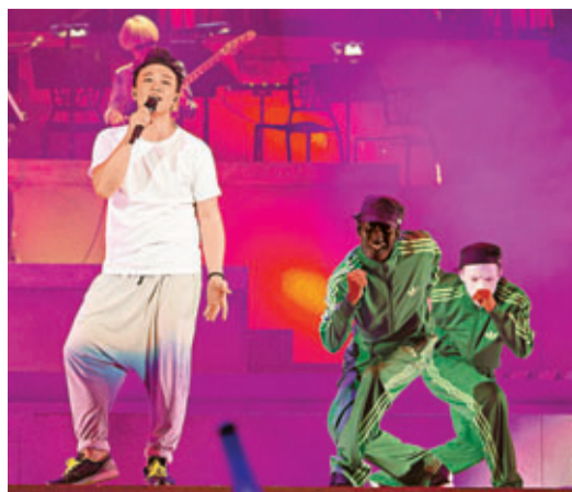
Eason在紅館繼續以歌會友。