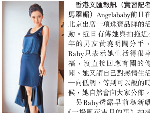
Angelababy表示現時生活幸福。

香港文匯報訊(實習記者 馬翠媚) Angelababy前日在北京出席一項珠寶品牌的活動。近日有傳她與拍拖近4年的男友黃曉明鬧分手，Baby只表示她生活得很幸福，沒直接回應有關的傳聞。她又謂自己對感情生活一向低調，等到可以說的時候，她自然會向大家公佈。