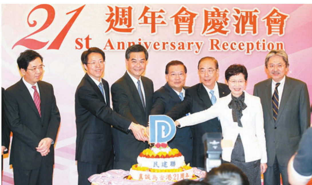
■主禮嘉賓切蛋糕，左起洪小勇、張曉明、梁振英、譚耀宗、楊孫西、林鄭月娥、曾俊華。

對於現時非常不穩定的政局，民建聯主席譚耀宗於致辭中坦言，「我們家在香港，同在一條船」，但現在有些人在船上爭吵，有些人不斷搖晃隻船，「我們大家正在努力穩住船身，使船隻可以繼續航行，希望大家一起為整體市民的福祉而努力。他又提到政改問題，指未來幾年，香港將為迎接2017年普選行政長官而做好準備，民建聯願同立會各黨派溝通協商，望協商出一個符合《基本法》及人大常委有關規定，又為市民所接受，同時又在立法會內能通過的方案，使香港在政制發展邁向新的一頁。