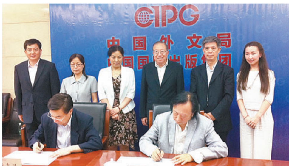
■中國文化研究院在北京與國家外文局舉行英文版翻譯簽約儀式。