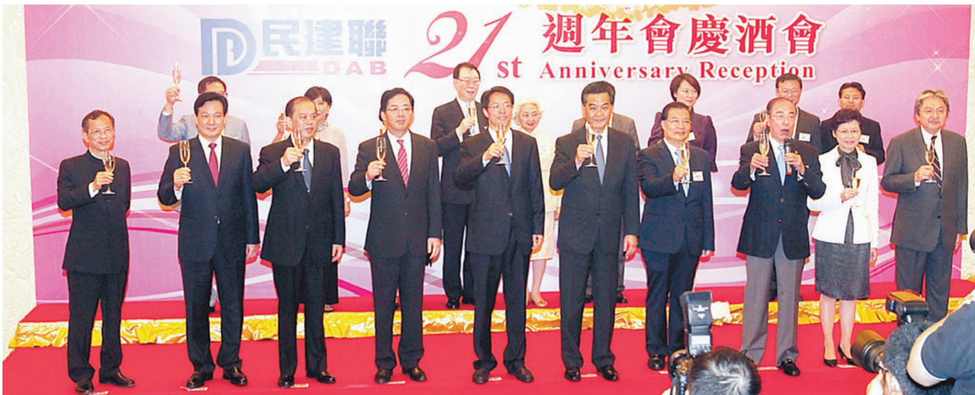
■民建聯21周年酒會。前排左起：曾鈺成、林武林、儲茂華、洪小勇、張曉明、梁振英、譚耀宗、楊孫西、林鄭月娥、曾俊華等賓主祝酒。