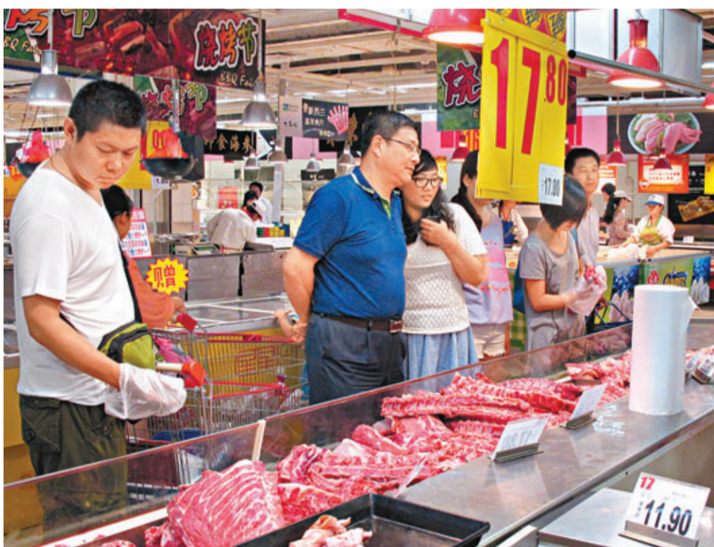
6月份內地CPI同比上漲2.7%，其中豬肉價格由降轉升。

不過，市場主流觀點認為，當前物價位於溫和可控區間內。國務院參事室特約研究員姚景源就指出，目前物價穩定與肉禽蛋菜價格總體穩定的局面分不開，鮮菜、鮮果進入消費旺季，上半年豬肉價格比去年同期下降3.7%，進入夏季豬