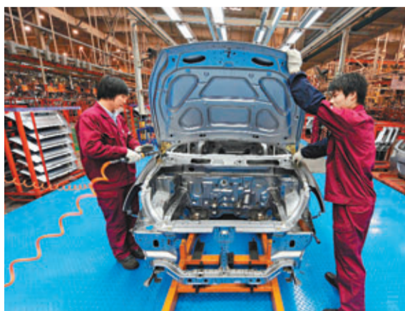
內地PPI已連續16個月錄得負增長。

香港文匯報訊(記者 海巖 北京報道) 國家統計局昨日公布，6月全國工業生產者出廠價格(PPI)同比下降2.7%，環比下降0.6%，超出市場預期。內地PPI自去年3月跌入負值以來，已連續16個月同比下降，顯示實體經濟尤其是工業需求不足，