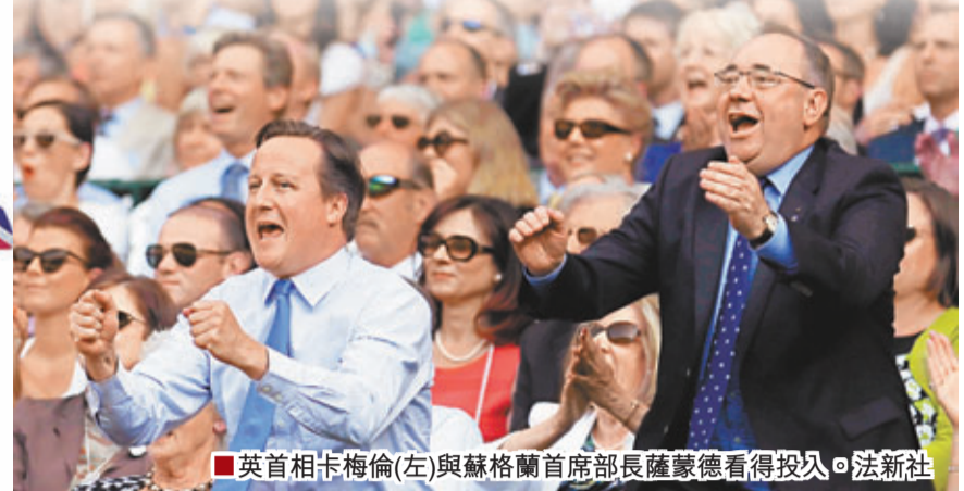
英首相卡梅倫(左)與蘇格蘭首席部長薩蒙德看得投入。

2013年7月7日，英國男網球手梅利在溫網決賽以總盤數3:0擊敗世界第一哥祖高域，職業生涯首次在這項歷史最悠久的大滿貫賽事稱王，在包括首相卡梅倫和英國王室成員的1.5萬名主場球迷面前，高舉溫網冠軍金盃，為這刻等待77年的英國人圓夢。背負全國希望的梅利完成「國家任務」，寫下英國網球新史，功勳卓著，賽後英媒呼籲英國王室為這名「英」雄封爵，而卡梅倫亦認為梅利值得獲此榮譽。