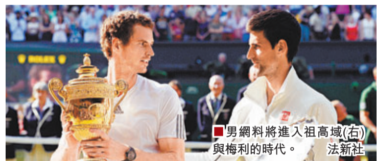
男網將進入祖高域(右)與梅利的時代。