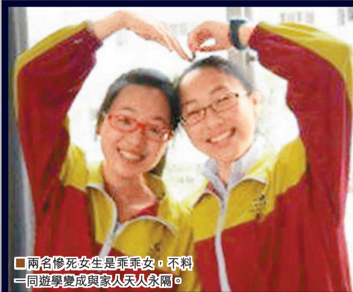
兩名慘死女生是乖乖女，不料一同遊學變成與家人天人永隔。