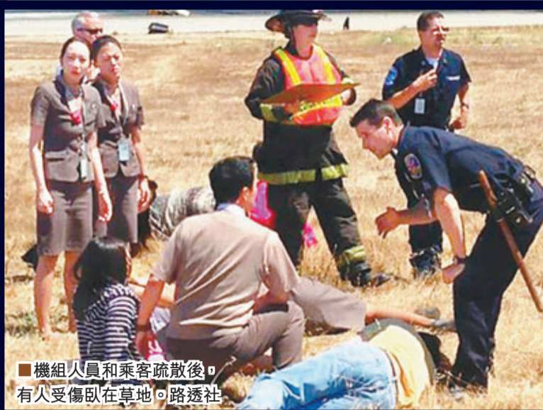
機組人員和乘客疏散後，有人受傷臥在草地。