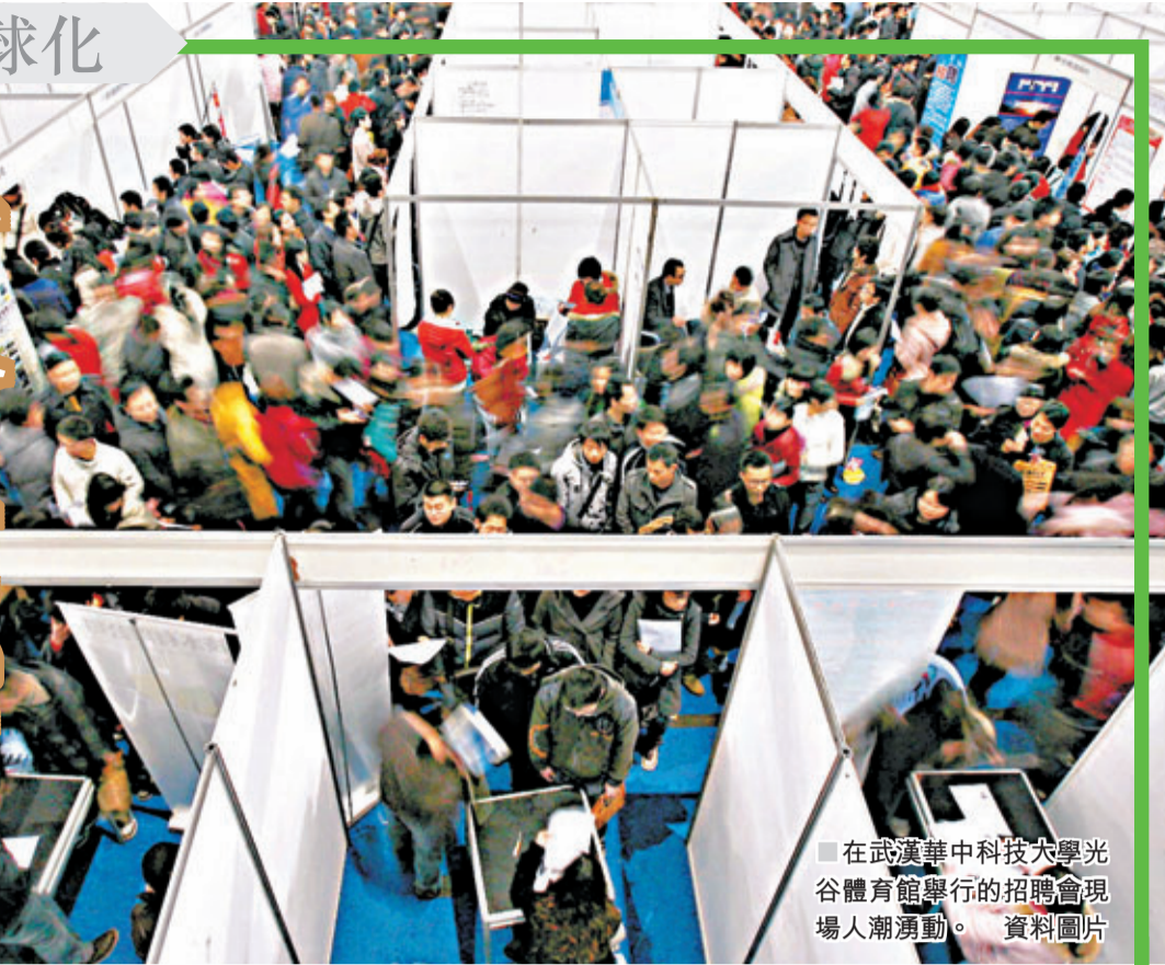
在武漢華中科技大學光谷體育館舉行的招聘會現場人潮湧動。資料圖片