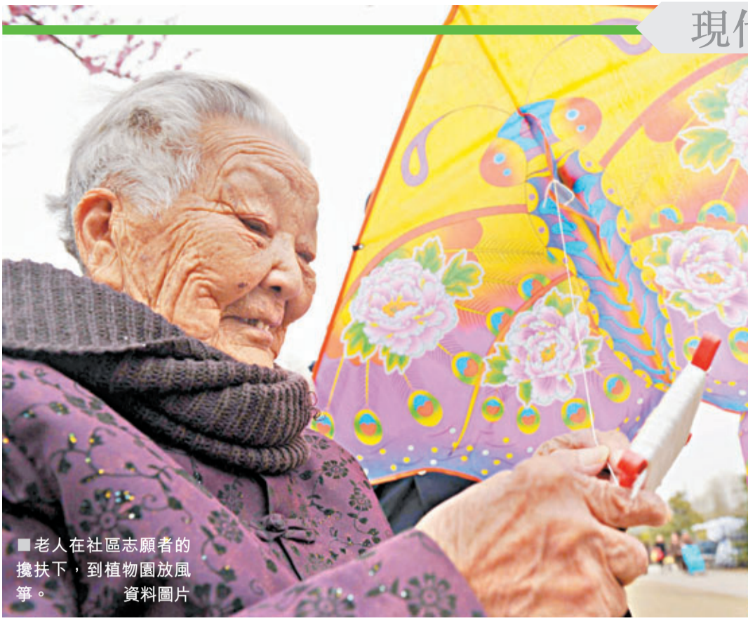
老人在社區志願者的攙扶下，到植物園放風箏。