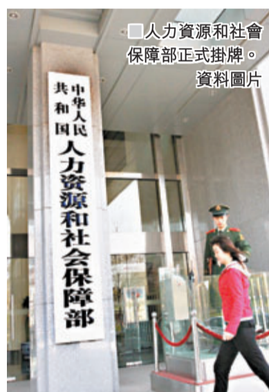
人力资源和社会保障部正式掛牌。資料圖片

延遲退休年齡可以一定程度緩解養老金的支付壓力，但不能寄希望於解決這一問題。延遲退休年齡與養老金支付危機有關。 據估算，中國退休年齡每延遲一年，可減緩養老基金缺口200億元（人民幣，下同）。如延遲5歲退休則意味5年能減緩養老基金缺口1,000億元。目前，養老保險涉及3個重要的參數：替代率、繳費率和退休年齡。近幾年，中國企業職工養老金的平均替代率都在50%以下，為了使老年人在離開工作崗位之後的生活獲得一定的保障，替代率不能再降；目前我國養老保險繳費率28%，而這樣的繳費率已經達到了較高的水準，沒有再提升的空間了。此時，只有退休年齡還有能夠調整的空間。延遲退休年齡對養老金起到多大的減緩作用呢？ 10年損失養老金6,000億 截至2011年底，中國養老金個人帳戶記賬額2.5萬億元，其中空賬額上升2.23萬億元。這意味着，用於將來養老金發放的這筆錢不存在。同時，現在結存基金由於通貨膨脹出現大量貶值。據相關估計，參照全國社保基金理事會2000年成立以來收益率9.17%，從2000年至2010年，養老保險基金以1.8%的利率存放銀行。以此計算，10年來養老金損失了6,000多億元。由此看來，在「2.23萬億元空賬」和「6,000多億元的貶值」面前，延遲退休1年減緩「200億」缺口微不足道。此外，從人社部公報看，去年財政補貼養老金達2,000多億。實際上延遲退休不能解決養老金支付危機。延遲退休年齡是一個趨勢，可以一定程度緩解養老金支付壓力，但不能寄希望於通過這個途徑解決問題。 ■資料來源：1.《延遲退休難解養老金壓力 民眾不滿雙軌制》，搜狐網 http://business.sohu.com/20120716/n348222534.shtml ；2.鄭秉文：《中國養老金發展報告2012》，經濟管理出版社，2012。