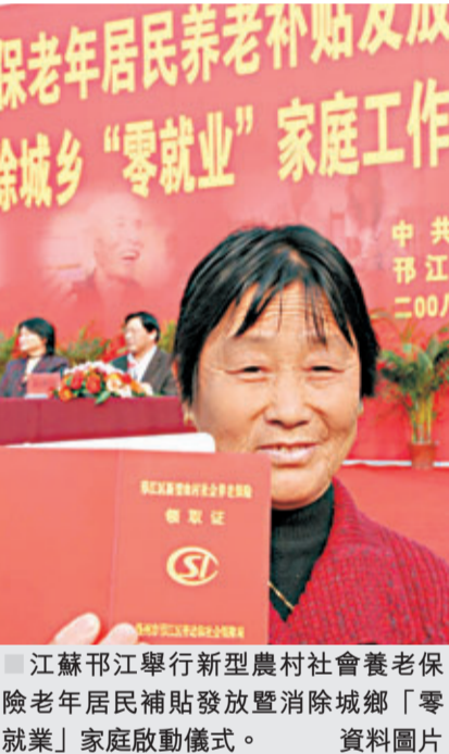
江蘇邳江舉行新型農村社會養老保險老年居民補貼發放暨消除城鄉「零就業」家庭啟動儀式。

從養老金誕生那天開始，就伴隨着空賬。根據最新的資料，中國現在的養老金空賬大約為1.3萬億元（人民幣，下同）。假若這些人到了60歲還繼續工作的話，那麼他們不僅不會領取養老金，還會繼續繳納養老金。有專家也算過一筆賬，退休年齡每延遲一年，中國養老金總基金可增長40億元、減支160億元，減緩基金缺口約200億元。 ■資料來源：《退休一年養老金減負多少？》，騰訊網 http://view.news.qq.com/a/20100913/000006.htm