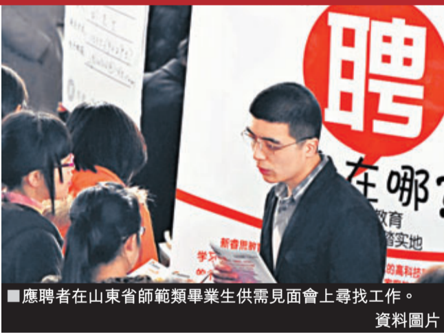
應聘者在山東省師範類畢業生供需見面會上尋找工作。資料圖片

在網絡論壇中有一位網友感歎：「現代人的壓力很大，中低層工作者的工資往往除了扣除社保金及所納稅金，拿到手中的實際工資，『所剩無幾』！這些『所剩無幾』的工資還要用來生活、還房貸、供養老人以及教育子女等，其實真的應該考慮把人員的退休年齡提前10年，女性45歲，男性50歲，這是最好的抉擇」。而另外，還有為數不少的下崗職工，他們都四五十歲，因為種種原因，很難再就業，就希望能夠到法定退休年齡可以拿退休金，政策一旦調整，他們無疑將會遭到巨大的打擊。再者，2009年，中國人的平均壽命為73歲。因此，假若將退休年齡推遲到65歲的