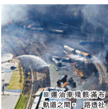
運油車殘骸滿布軌道之間