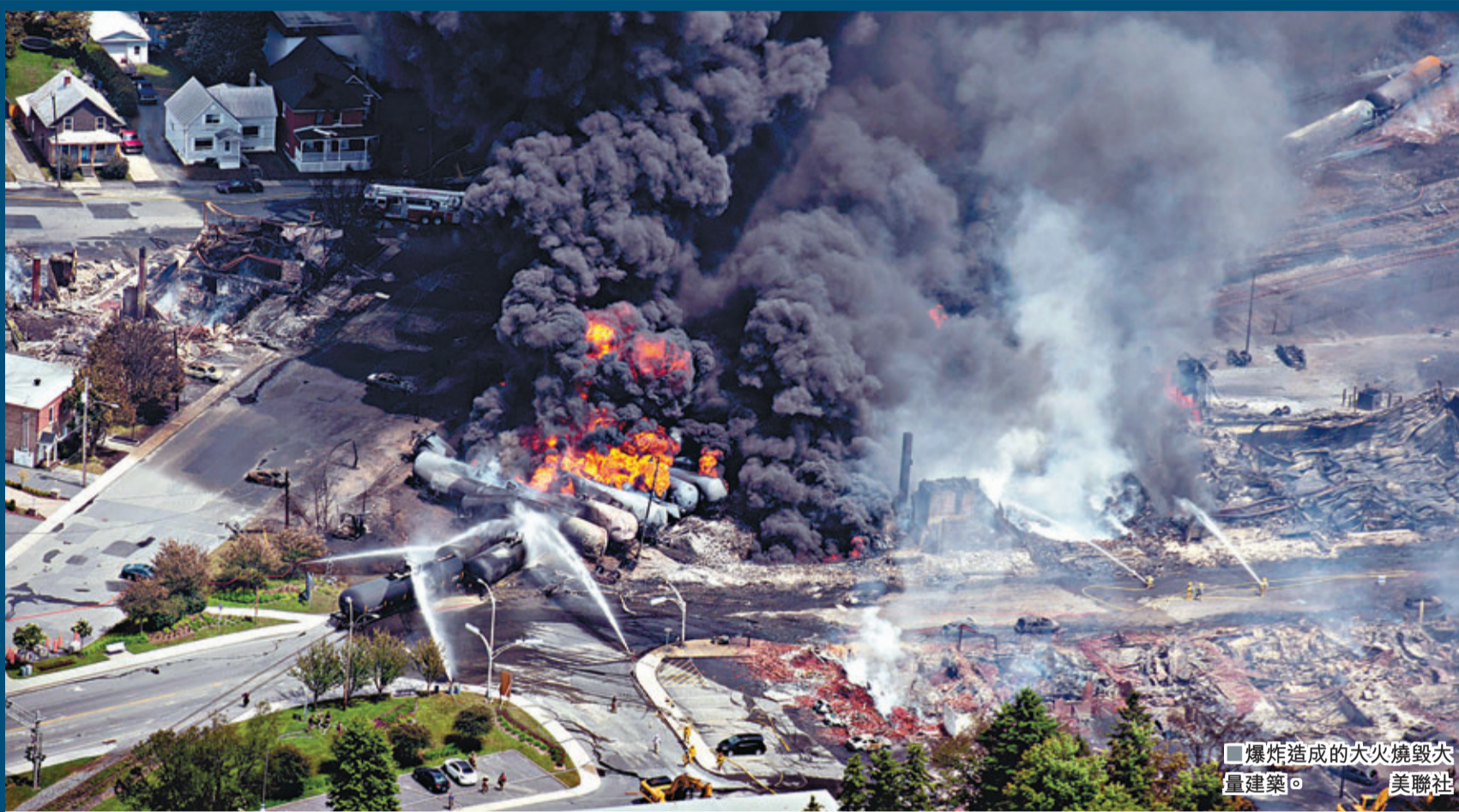
爆炸造成的大火燒毀大量建築

加拿大魁北克省東部小鎮前日凌晨發生嚴重意外，一輛運油火車出軌爆炸，波及附近建築物，造成最少5死、最少40人失蹤，2,000名居民須緊急疏散。當時火車衝入小鎮，火球升上半空，目擊者形容如拍戲情節，跟原子彈爆炸一樣可怕，寧靜社區瞬間變成人間煉獄。