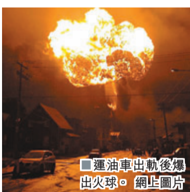
運油車出軌後爆起火球