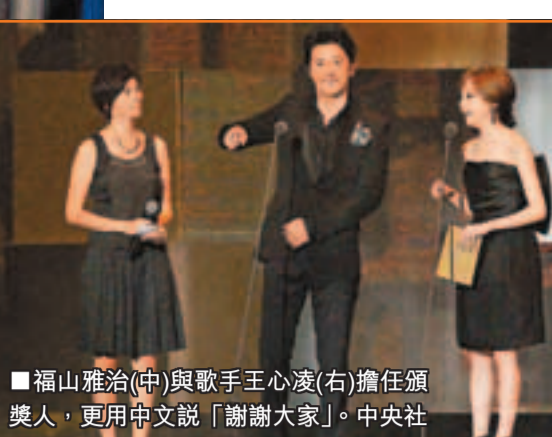
■福山雅治(中)與歌手王心凌(右)擔任頒獎人，更用中文說「謝謝大家」。