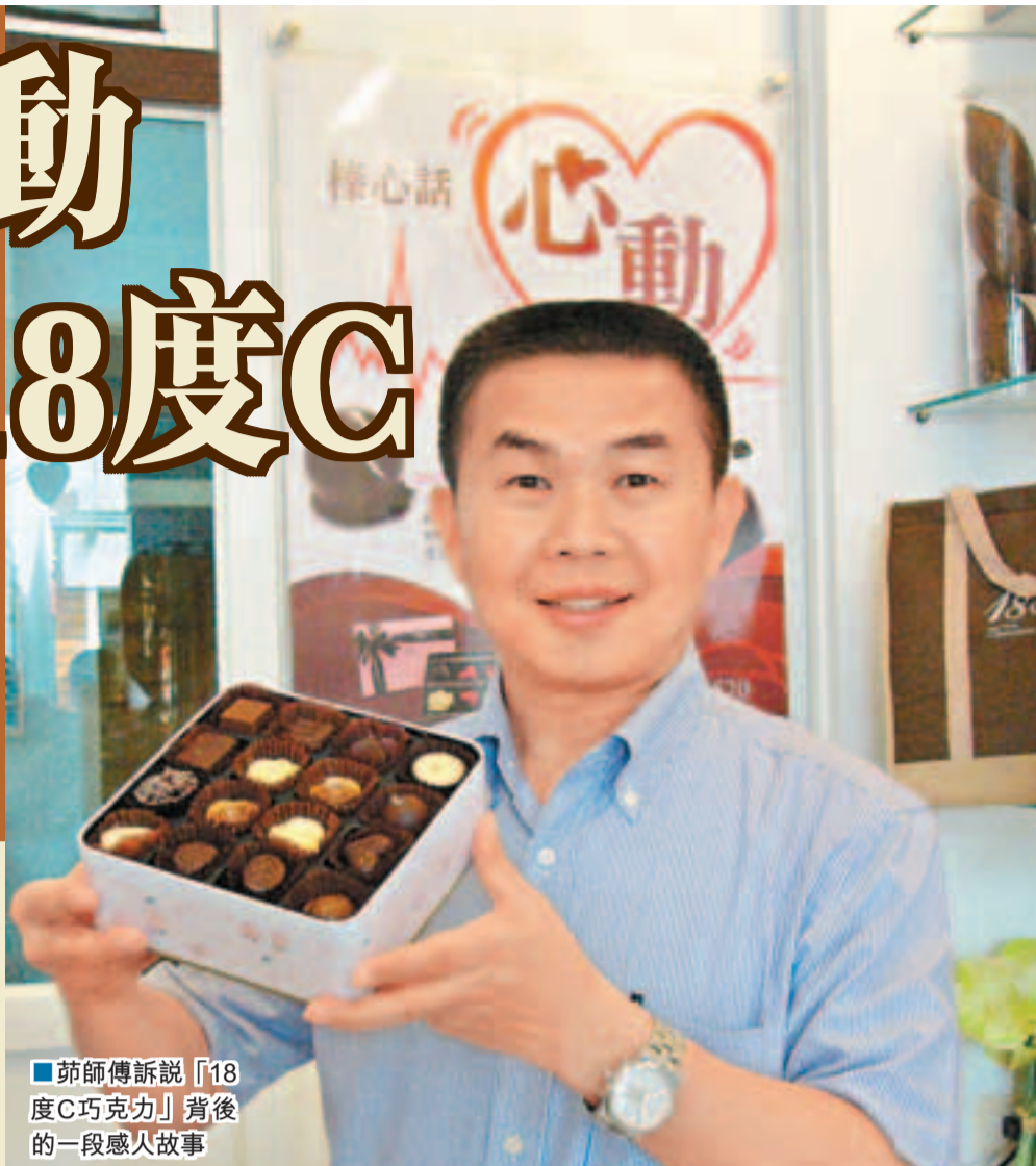
蒞師傅說「18度C巧克力」背後的一段感人故事