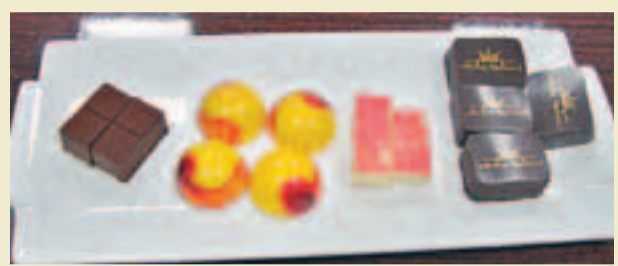
生巧克力、紅玉芒果、踏雪尋莓、阿薩姆茶香