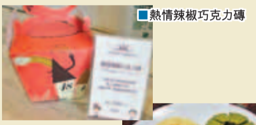
熱情辣椒巧克力磚