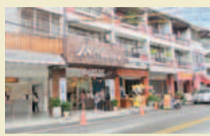
專賣店在工房對面，經常見排隊人龍，為保持店內室溫，限制入店人數。