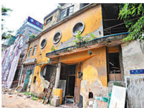
「金陵台」被強拆前原貌。

報告指出，依據《中華人民共和國治安行政管理處罰法》和《刑法》「故意損毀公私財物」相關規定移交司法機關。對房屋所有人造成