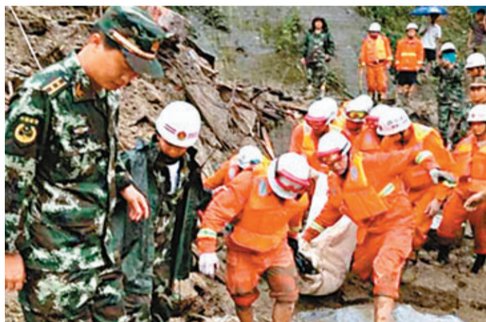
四川雅安發生泥石流災害，救援人員在災場抬出一名遇難者遺體。

災情發生後，省市縣三級政府立即組織搶險救災工作，鹽津縣啟動突發性地震災害應急預案，200餘名搶險救災人員趕赴受災現場。目前，受災群眾已得到妥善安置，雲南省、昭通市相關部門正排查災害隱患，鹽津縣鎮村幹部已深入各鄉鎮村組全面開展核災查災救災，嚴防次生災害的發生。