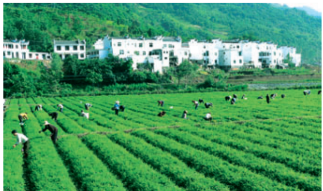
陝西省平利縣絞股藍種植基地

現在的平利縣百草堂生物科技有限公司，正努力爭取在2015年前上市，實現全民參與、社會共用的民族企業目標；並致力於在10年內使加盟連鎖機構達到100萬家，讓平利百草堂的絞股藍茶成為消費者養生的忠實伴侶，為人類健康事業做出自己的一份貢獻。