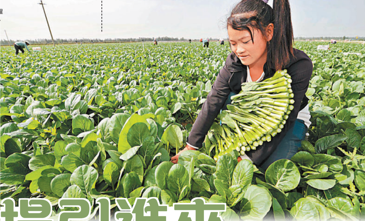
農民被視為「東方奇蹟」的幕後功臣。 資料圖片

一種現代農業家庭組織，以農戶家庭為基本組織單位，以市場為導向，近似或完全公司化運作(工商註冊、自主經營、自負盈虧)，以利潤最大化為主要目標，專業從事適度規模的農林牧漁的生產、加工和銷售的農業經營主體。在管理效率、產出效益和示範效應方面，美式家庭農場獲得世界範圍的普遍讚譽。美國農業部農場服務局是農場法律法規的執行機構，對家庭農場的定義非常詳盡：大量生產銷售農產品、擁有足夠盈利以支付運營費用、自營管理、可聘請全職或季節性兼職員工。