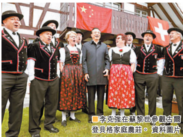
李克強在蘇黎世參觀古爾登貝格家庭農莊。 資料圖片