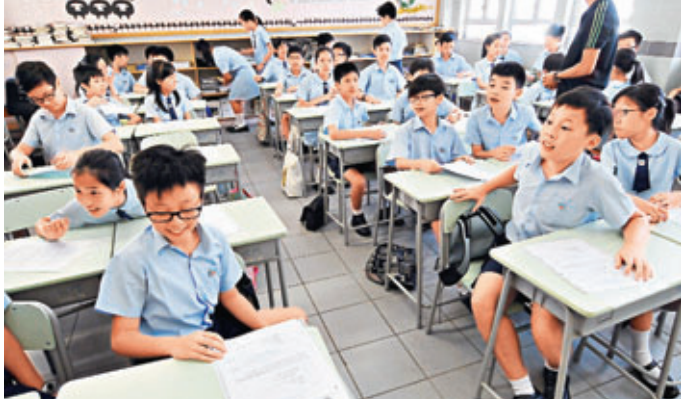
中學派位經過減派的調整後,大部分地區亦依然面對學額過剩問題,其中屯門就有650個統一派位學額無足夠學生入讀。圖為以往派位結果公布情況。