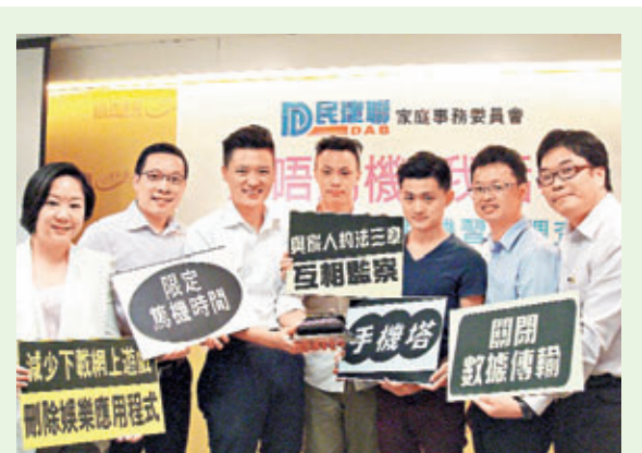
民建聯建議青少年出席聚會時可自發疊成「手機塔」,互相監督,避免沉迷電玩。

去年院校公布首屆文憑試收生成績要求時,除了科技大學理學院和工學院將M1及M2視為獨立選修科外,其他的課程都將M1及M2當作「半科」計算。不少學生有感該科認受性低,學習壓力大,因此紛紛退修。有見及此,港大及浸大的理學院宣布今年收生時會視M1及M2為獨立的選修科,以鼓勵學生修讀,提升理科生數學水平。