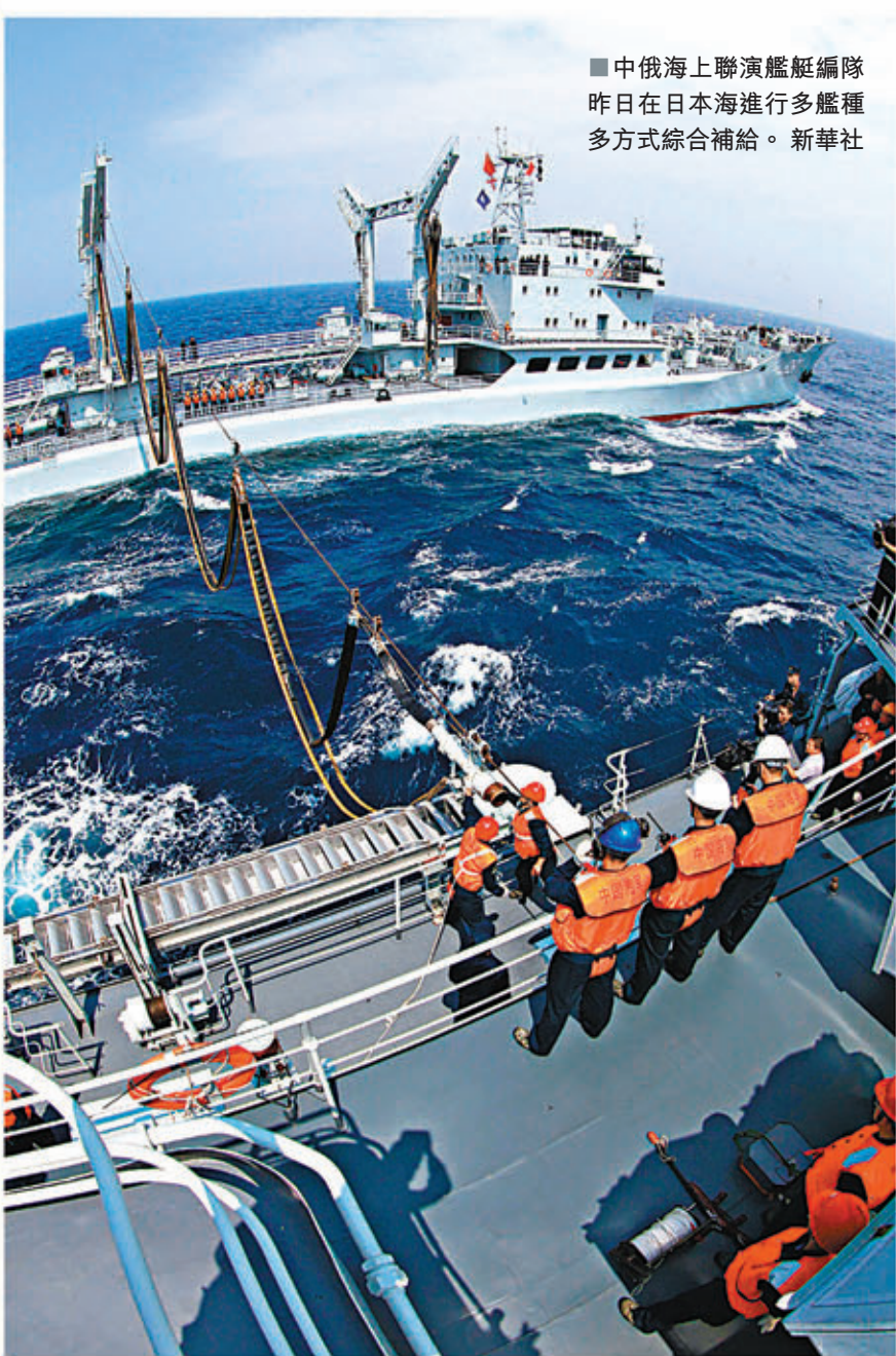
中俄海上聯演艦艇編隊昨日在日本海進行多艦種多方式綜合補給。

香港文匯報訊(記者 葛沖 北京報道)赴俄羅斯參加中俄「海上協作—2013」聯合軍事演習的中國海軍艦艇編隊,昨日在航行第四天的日本海海域,重點進行了首次海上多艦種多方式綜合補給,正在順利駛向俄太平洋艦隊母港符拉迪沃斯托克(海參崴)港外的彼得大帝灣海域,中俄艦隊將於今日會師。5日至12日,中俄大規模海上聯合演習將正式拉開帷幕。中方參加是次軍演是向國外派出兵力最多的一次,而俄方的太平洋艦隊亦將盡遣精銳,有「航母殺手」之稱的瓦良格號巡洋艦,及有「大洋黑洞」之稱的俄基洛級常規潛艇等將悉數參演,而反潛深彈實射和通過敵潛艇威脅區等將是重要看點。