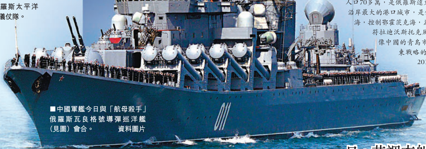
中國軍艦今日與「航母殺手」俄羅斯瓦良格號導彈巡洋艦(見圖)會合。 資料圖片