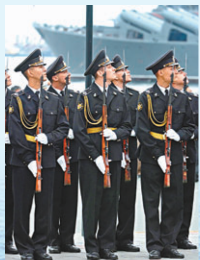
俄羅斯太平洋艦隊儀仗隊。