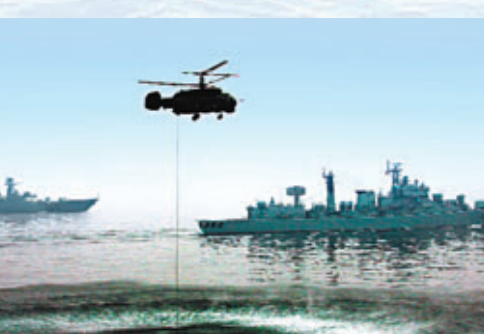
在「和平使命-2005」聯合軍事演習中,艦載直升機正在吊放聲納,搜索敵軍距離。

度甚至進行擠壓的做法,羅援認為,中國既需有戰略耐心,用事實證明,也要有戰略定力,堅持走自己的路。