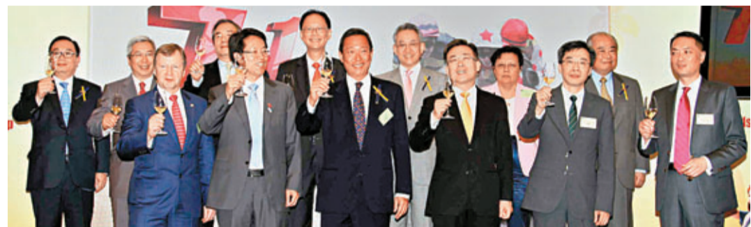
一眾主禮嘉賓祝酒，慶祝特區成立十六周年，包括中聯辦主任張曉明（前排左二）、外交部駐港特派員宋哲（前排右二）、馬會副主席葉錫安博士（前排中）、馬會董事周永健（後排右四）、陳南祿（後排左四）、葉澍堃（後排左三）、范徐麗泰博士（後排右三）、李家祥博士（後排左二）、周松崗爵士（後排右二）、廖長江先生（後排左一）、馬會行政總裁應家柏（前排左一）、立法會議員李國麟博士（前排右一）及香港中華廠商聯合會副會長吳永嘉（後排右一）。

「七·一」是香港回歸祖國的大日子，對香港來說意義重大。為慶祝這別具意義的一天，香港賽馬會於剛過去的七月一日特別舉行「香港共慶回歸賽馬日」，藉着兩場緊張刺激的主題盃賽和各項嘉年華慶祝活動，一眾中央及特區政府官員、本港政商界領袖等，與數以萬計市民及遊客，在沙田馬場一起慶祝特區回歸紀念日，同時向國際展示香港回歸十六年來「馬照跑」，體現賽馬運動對香港的重要，並見證「一國兩制」成功落實。