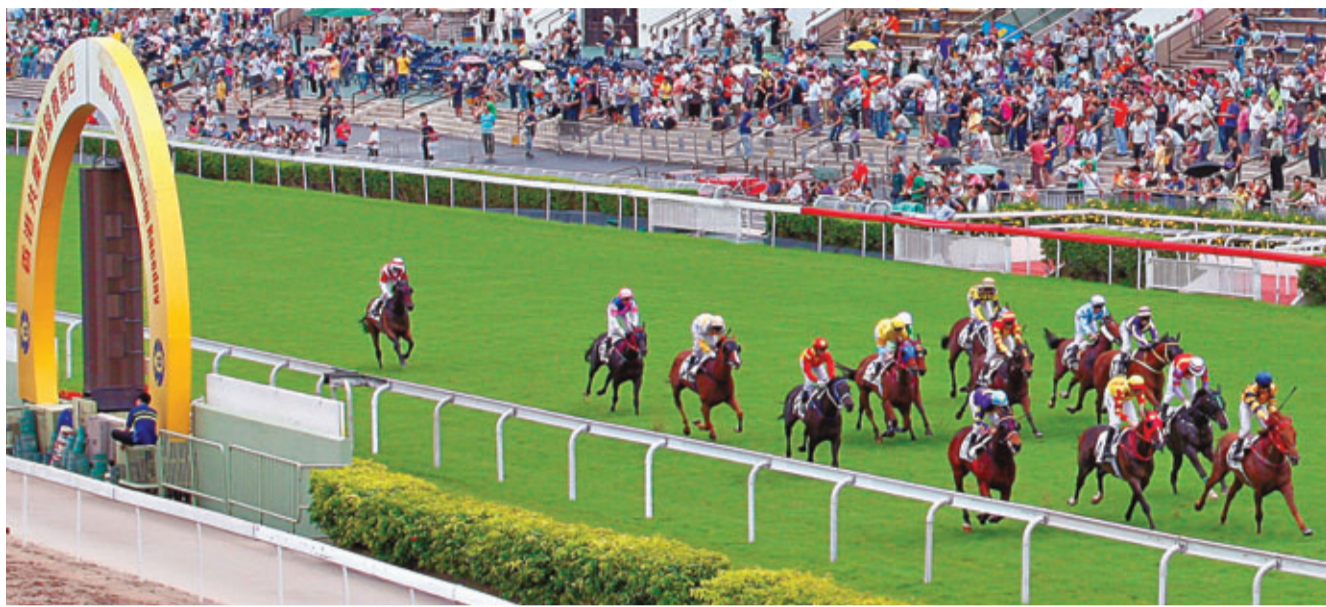
馬會特別舉辦「香港共慶回歸賽馬日」，與數以萬計市民共慶回歸「馬照跑」。