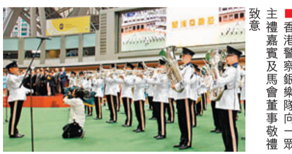
主禮嘉賓及馬會董事敬向一眾嘉賓致意。

葉博士續指，馬會已發展為全球最頂尖的賽馬機構之一，也是香港最大的慈善公益資助機構，「馬會於過去一年的慈善捐款破紀錄，逾港幣十七億元，共資助超過一百五十個社會項目。」預計全港有約五百四十萬人受惠於馬會捐助的項目，約佔全港總人口的七成五；馬會更是香港最大的單一納稅機構，於二〇一〇/一一財政年度所繳稅款，便超過一百六十億港元，佔稅務局總稅收的百分之六點八。