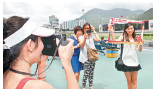
馬會精心安排多項慶祝活動，令沙田馬場洋溢喜慶的歡愉氣氛，市民和遊客有如置身嘉年華會之中。

今年是香港回歸祖國十六年，馬會一如往年，在回歸日舉行重頭戲「香港回歸盃」賽事，以及由香港中華廠商聯合會贊助，以「工展顯關懷 廠商慶回歸」為主題的「廠商會工展慶回歸紀念盃」，與市民一起體現香港回歸後「馬照跑」。大會更邀請著名書法家施子清為盃賽口號「工展顯關懷 廠商慶回歸」題字，及把作品印製成手扇，免費派發給當天入場的約二萬五千名市民，讓大家消暑解暑。