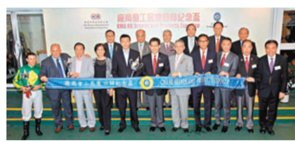
同日舉行的「廠商會工展慶回歸紀念盃」由商務及經濟發展局局長蘇錦樑（前排中）、香港中華廠商聯合會會長施樂傑（前排右四）及副會長吳永嘉（前排右三）頒獎，並與一眾馬會董事、嘉賓及勝出的馬主、練馬師及騎師合照。