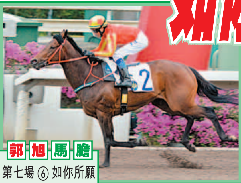
郭旭馬膽 第七場 ⑥ 如你所願

第四場 、第四班、一二〇〇米(泥地)。今場放頭馬甚少,預計步速或會偏慢,形勢較有利擺前守好位及中置型跑法馬。「快快贏」早前兩勝五班此程反彈後,重回四班兩仗皆未有表現,至剛仗折返途途泥地千二米,再度發揮出水準,與「駕聖」叮嚀馬頭影相僅敗,本身跑法狗主動佔點優勢,補中機會樂觀。「真寶馬」季內連拆下狀態逐漸到頂,上仗首度跑泥賽,角逐千二米途程,因排十一檔關係,起步後拖至馬群尾位置競逐,末段愈迫愈勁,最終僅輸給頭馬四分三身位,經一場試場場地後再來,有輕磅之助,有力衝擊頭馬。「香港至尊」今季跑得不多只跑過七仗,雖然仍未能取得頭馬交代,但於泥地千二米六戰累積三亞一季,演出甚穩定,佔一席相信不難。「海豚」上場轉投名家良馬房初出角逐此程,起步後守貼欄四五位,入直路早段受困,稍遲才望空,最終只輸個半馬位得第五,今回用王牌再來,有輕磅之利,可左右大局。