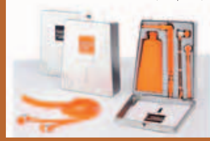
Painted Tunes 1 (HK$198)