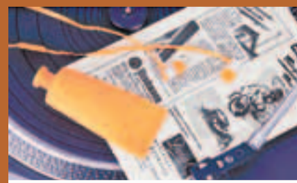
Painted Tunes 2 (HK$498)

而另一款Painted Tunes 2，亦在油彩的概念上，加入金屬的元素，外殼以鋁合金打磨，堅固耐用，加上油彩的點綴，令耳機仿如調色板的一部分。它使用10mm動圈單元，配上鍍合金磁鐵，提供更優良的動態表現，適合節奏強勁的流行音樂。耳機線為5mm闊的扁平線身，亦具防纏作用，其3.5mm鍍金插頭亦有保護設計，L插頭位置經過雙重壓鑄，防止插頭因屈曲而損壞。最吸引筆者的是其包裝及配件配合了油彩的主題，以裝油彩形設計的便攜套，每次取出耳機時都會令人有一種會心微笑的感覺。