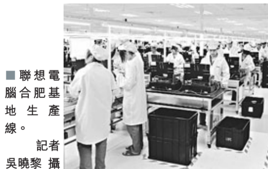
■聯想電腦合肥基地生產線。

香港文匯報訊(記者 張長城 合肥報道)合肥新港工業園成立5年來，基礎設施不斷完善，重大項目相繼落戶。依托合肥出口加工區平台，新港工業園已引進聯想(合肥)產業基地、崧質科技等一批重大項目，外向型經濟模式初步形成。今年，新港工業園將重點圍繞「壯大工業經濟、拓展園區平台、推動微地拆遷、保障社會民生」開展工作，力爭招商引資20億元(人民幣，下同)，包括外資1億美元，實現工業產值超過300億元。