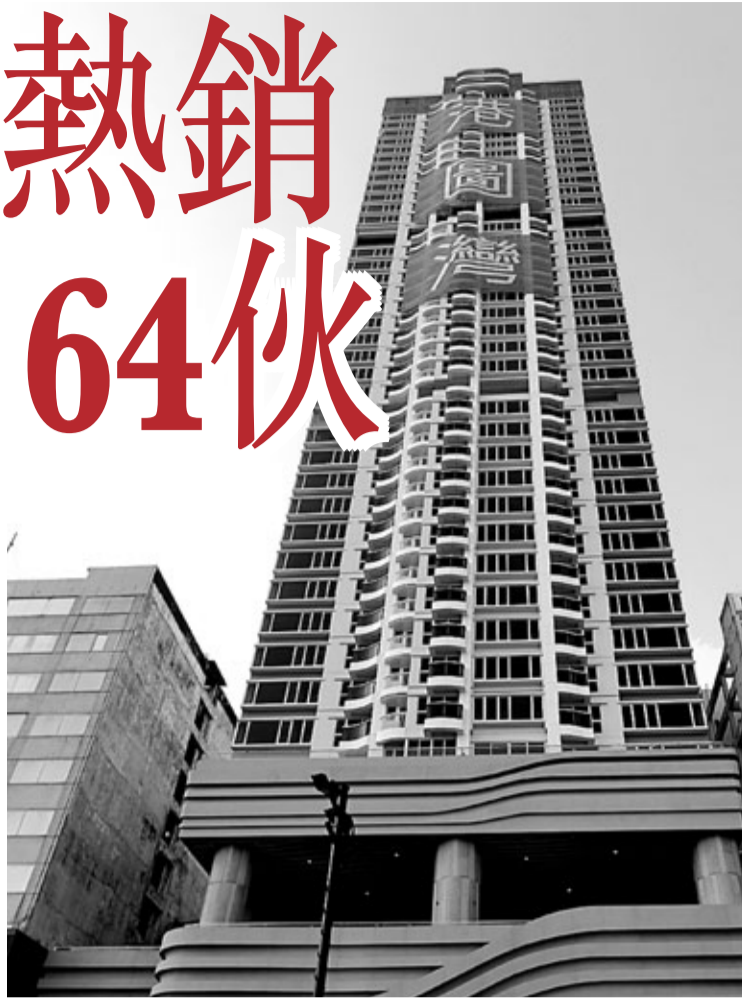
位於士瓜灣的港圖灣過去2天售出64伙，套現逾7.6億元。資料圖片

同時，新例下不准售樓書印上發展商的標誌，因此曉蒼最尾的兩頁，已不再見發展商的名稱及公司商標標誌以及「家·築動愛」的字句。