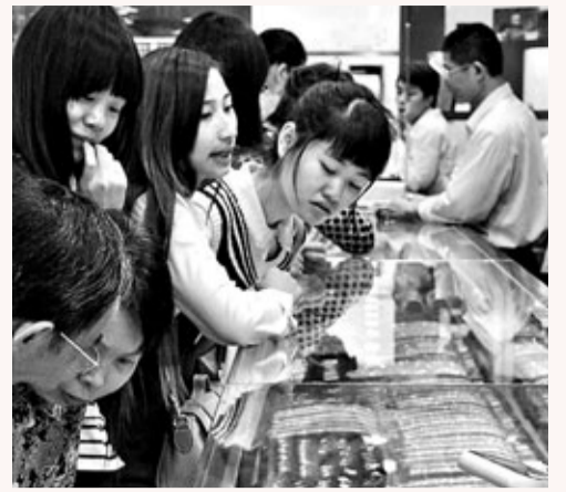
金價持續下跌，穗市場未再現4月份的搶金潮。

香港文匯報訊(記者 古寧 廣州報道)金價的連續下跌，讓相關企業叫苦不迭。廣東黃金協會相關人士透露，目前已有六七成的廣東業內企業產生一定額度的損失。由於大部分廣東珠寶企業未作套期保值，導致總體資產兩個月縮水超100億元(人民幣，下同)，部分大企業甚至損失過億。業內人士甚至預計，如果金價跌勢持續，將有大批的小企業被淘汰出局。