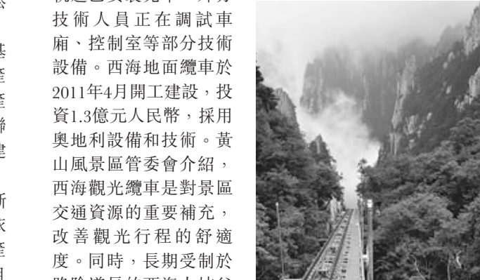
■黃山西海觀光纜車工地現場。

記者在黃山風景區西海觀光纜車工地看到，纜車地面軌道已安裝完畢，外方技術人員正在調試車廂、控制室等部分技術設備。西海地面纜車於2011年4月開工建設，投資1.3億元人民幣，採用奧地利設備和技術。黃山風景區管委會介紹，西海觀光纜車是對景區交通資源的重要補充，改善觀光行程的舒適度。同時，長期受制於路險道長的西海大峽谷