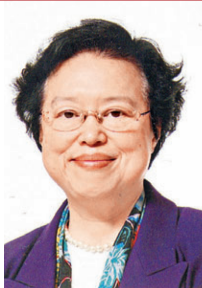
譚惠珠：推介《基本法》貢獻多

釋覺光法師長期熱心服務社會,表現卓越,尤其致力帶領香港佛教聯合會弘揚佛教,以及推動社會慈善服務,貢獻良多。作為香港一個主要佛教組織的會長,釋覺光法師領導香港佛教聯合會提供多元化的社會服務,包括醫療、教育、幼兒及安老服務等。該會與其他地區之佛教團體及國際機構保持緊密聯繫及交流,就提升香港在海內外佛教界的地位方面,貢獻良多,殊堪表揚,現獲頒授大紫荊勳章。