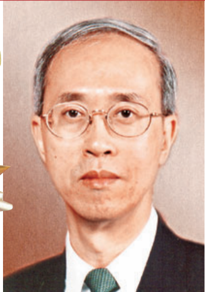
陳兆愷：倡法院程序用中文

陳兆愷法官盡心竭力為司法機構服務,表現卓越,尤其在出任終審法院常任法官期間,克盡厥職,忠誠維護香港法律。陳兆愷法官對建立終審法院的聲望,以至奠定其為普通法適用地區重要法院之一的地位,貢獻尤多。他又致力倡導法院程序使用中文,而且在提高法官的判詞撰寫技巧,以及就重要判詞建立一套中文判例彙編模式方面,建樹良多,現獲頒授大紫荊勳章。