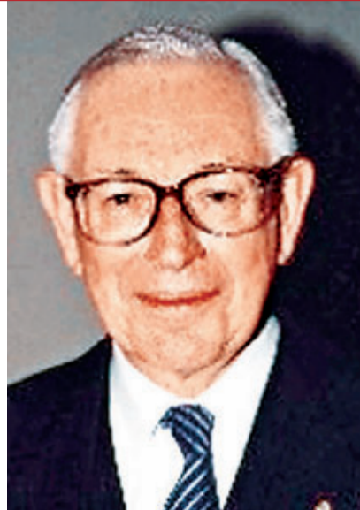
梅師賢：確立新憲制下港位置

陳兆愷法官盡心竭力為司法機構服務,表現卓越,尤其在出任終審法院常任法官期間,克盡厥職,忠誠維護香港法律。陳兆愷法官對建立終審法院的聲望,以至奠定其為普通法適用地區重要法院之一的地位,貢獻尤多。他又致力倡導法院程序使用中文,而且在提高法官的判詞撰寫技巧,以及就重要判詞建立一套中文判例彙編模式方面,建樹良多,現獲頒授大紫荊勳章。