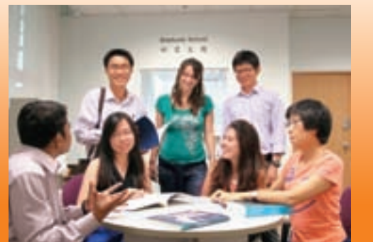
■雄厚教研實力支援教院研究生