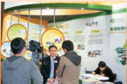
■媒體採訪教院招生活動