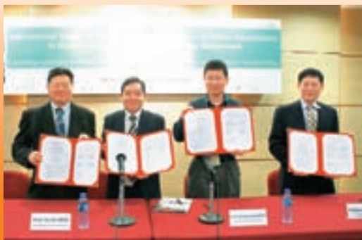
■教院與全球超過140所高等院校簽署協議，進行學術協作及學生交換計劃。