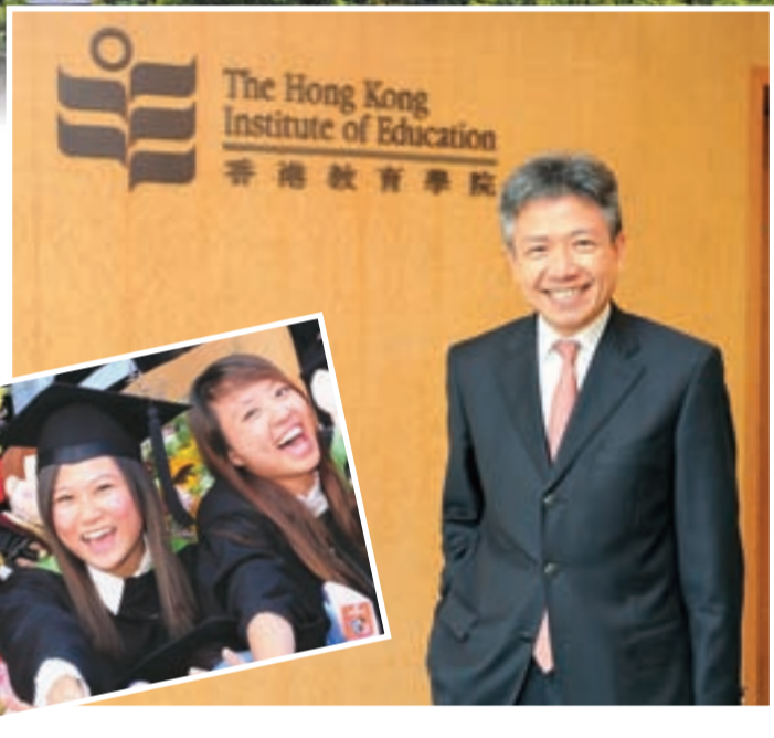
■將於今年9月到任的教院校長張仁良教授

教院已與超過50所內地、台灣著名的高等院校及教育機構建立夥伴關係，其中內地夥伴包括北京師範大學、華東師範大學、中國傳媒大學、中國音樂學院、北京語言大學等，而台灣夥伴則有國立台灣師範大學、國立政治大學、國立中央大學、國立暨南國際大學、元智大學等。迄今，教院已跟全球超過140所高等院校及教育組織簽署合作協議，進行學術協作及學生交換計劃。教院致力於校園內外提供與內地及海外的交流經驗，以擴闊學生的國際視野，同