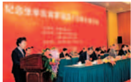
2011年5月在北京全國政協禮堂舉辦紀念張學良將軍誕辰110周年的活動。