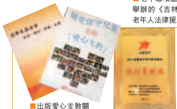
出版愛心支教關愛留守兒童刊物

「非常敬佩張學良將軍的愛國精神，為近年史上的愛國典範，我在東北成立醫院時，從老病患者得知張學良夫婦於上世紀二十年代，在東北窮鄉僻壤建立了數百家希望小學，使窮困失學兒童得到教育，張學良將軍的愛國愛民的精神，希望我們這一代人能傳承下去。」張副會長及其醫療團隊將會發揮其醫療上的專長，對張學良基金會於殘疾、老年病患者之福利作出貢獻。