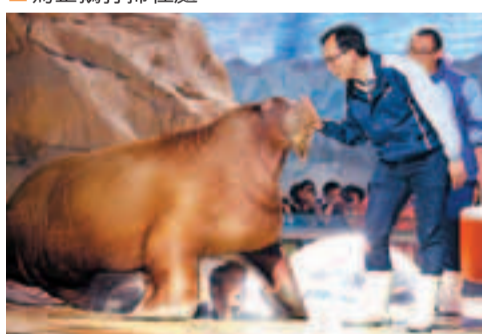
動物護理專家正為太平洋海象提供護理訓練。

府向香港贈送的一對名為「安安」、「佳佳」的大熊貓，開創了大型陸生動物進駐海洋公園的先河。在此之後，中華鱉、小熊猫、揚子鱉和金絲猴等一批來自內地的珍稀動物也陸續安家海洋公園。