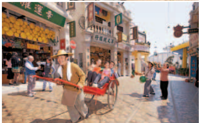
香港老大街將人們帶回六、七十年代的香港。