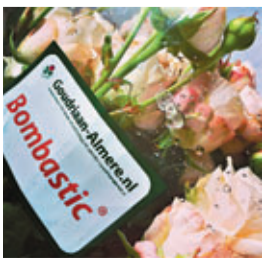
「Garden roses by David Austin」

在花藝課堂中，我喜歡簡單、直接、易明的教學方式；在文字的界面，卻可以系統性的方式，淺說歐洲式花藝的基本功學習入門。現在為大家介紹選擇花材的方法和竅門。