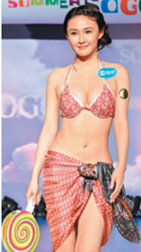
Speedo Health & Wellbeing系列

Speedo每季都會推出一系列鮮艷搶眼的不同款式泳衣，今季也不例外，如大玩撞色的花花及幾何圖案比堅尼，精巧細緻、配備可愛小短裙或褲的Two-piece，以及能全面保護肌膚的長袖款Sun Protection泳裝，讓不同喜好及需要之女生隨意選擇，穿出不同韻味的水着造型。