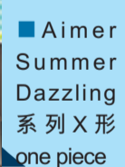
Aimer Summer Dazzling系列X形one piece