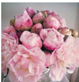
選擇優質的歐洲花材