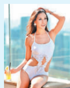
Aimer Lace Sensation系列One piece

高級時尚內衣品牌Aimer今年亦推出泳裝系列，更把晚裝設計融入泳裝當中，令人恍如置身於海邊的時尚舞會。例如，Lace Sensation和Stunning Allure系列以刺繡花紋、lace花邊配襯glossy物料的泳衣，展現泳衣華麗精緻的一面，打造與眾不同的Beach Couture。