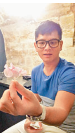
經驗可以提升花感

文、圖：Henry Leung 面書：Whim W-him 微博：Henry_Whim