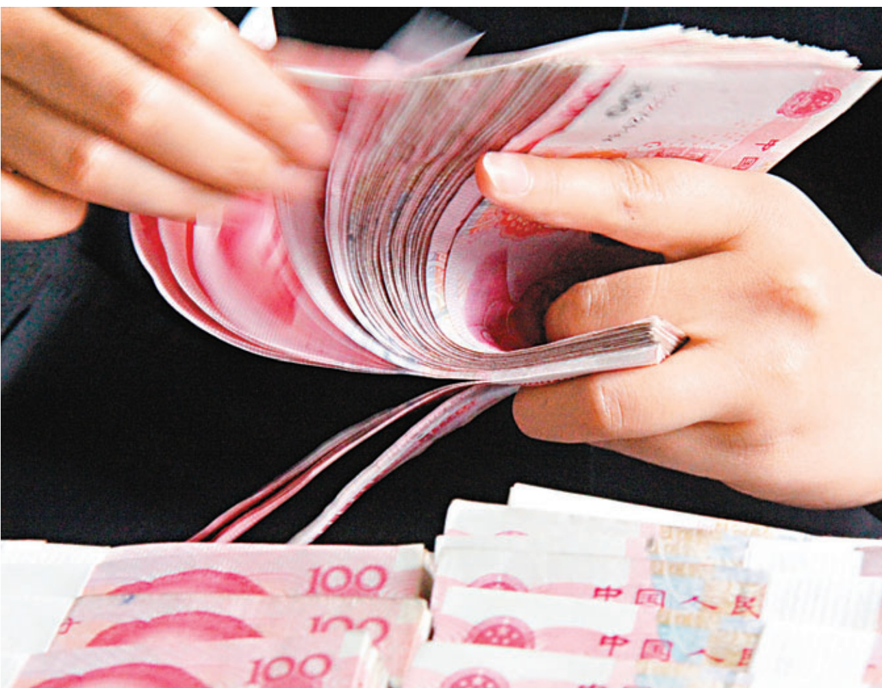
■國務院下月召開經濟形勢分析會，將研究「錢荒」問題。圖為銀行工作人員在清點人民幣。

國務院發展研究中心金融所研究員巴曙松則指出，從目前趨勢看，宏觀金融政策操作，開始從應對短期經濟金融頻繁波動的脈衝式政策操作中逐步淡出，穩健的貨幣政策基調並沒有變化，不再因為短期的經濟回落而盲目匆忙擴張貨幣，也不會因短期市場波動而大幅收縮。