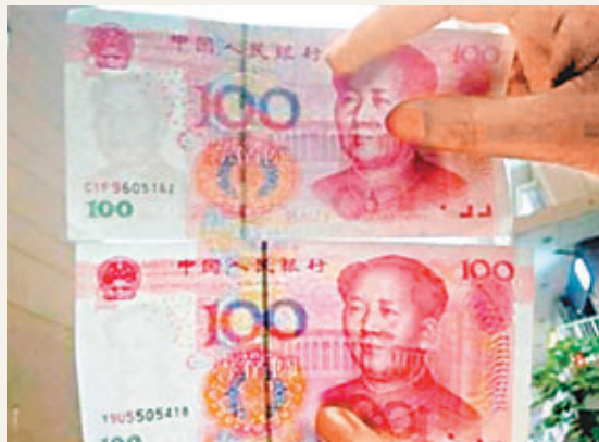
■上圖假幣：人物面部泛白，水印發黑。下圖真幣：人物面部紅潤，水印發亮。

香港文匯報訊 據《新京報》報道，不久前在山東省被首次發現「C1F9」開頭的高仿百元假幣，近日在北京一家公司內部售賣電腦的過程中出現。前日，記者持這張假幣前往銀行檢驗，銀行工作人員證實其是偽鈔，但在驗鈔機的5次檢驗中，兩次顯示正常。