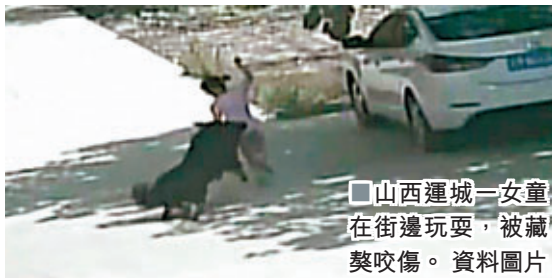
■山西運城一女童在街邊玩耍，被藏獒咬傷。 資料圖片

央視新聞29日指出，近期各地曝出多起烈性犬傷人、致死事件。烈性犬以忠誠猛烈著稱，但不加以約束，則會威脅公共安全。烈犬賴以恃寵的特性變成令人深惡痛絕的劣性，錯不在狗，在主人；不文明的養養必被文明所不容。愛狗，要負責。管狗，得先管好人。