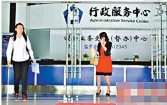
■全國人大29日通過12部法律的修正案，促進政府職能轉變。圖為廣東一家行政服務中心。

香港文匯報訊 據中新社報道，十二屆全國人大常委會第三次會議，29日在北京經表決通過了國務院關於提請審議文物保護法等12部法律的修正案，這些法律分別從各領域簡化、下放和取消了原上級主管行政機構的行政審批權。此次，立法機關「打包」修改有