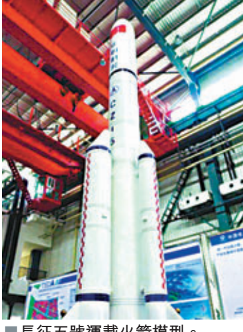
■長征五號運載火箭模型。

該型火箭採用無毒、無污染推進劑，肩負着實施探月工程三期等重大科技專項發射任務，將大幅提高運載技術水準，完善運載火箭型譜，提升中國自主進入空間的能力，為建設航天強國，實現中國夢提供強勁動力。