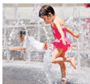
洛杉磯有女童在噴泉下玩水消暑。