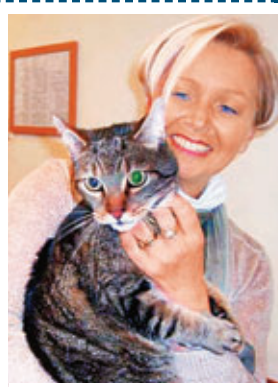
普斯與主人團聚。

法國勒阿弗爾的3歲小貓普斯兩日前離家出走，主人遍尋不獲，後來被人發現牠原來跑上了一艘由法國駛到英國多佛的渡輪。由於普斯沒持寵物護照「入境」，按慣例須接受檢疫或人道毀滅。幸好多佛有獸醫願免費為牠辦好所有手續和注射疫苗，經法國警方協助下終與主人團聚。