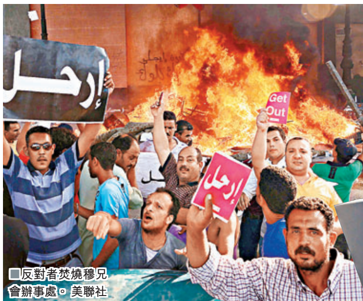
反對者焚燒穆兄會辦事處。

兩派對台 美籲公民押後前往 美國總統奧巴馬昨日對埃及政治衝突表示關注，呼籲穆爾西以「更建設性」方法帶領國家前進。美國國務院前晚呼籲非緊急外交人員離開埃及，並提醒公民如非必要應押後前往當