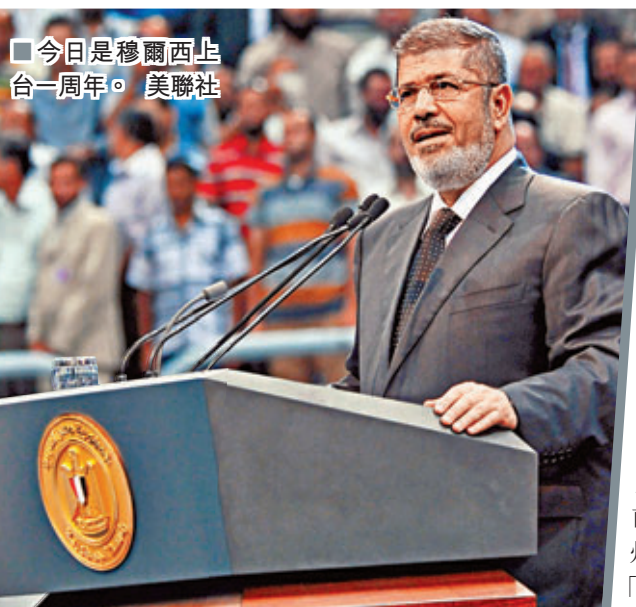
今日是穆爾西上台一周年。