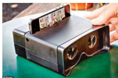
把iPhone放入配件內就可拍攝。

美國有發明家研製出可讓iPhone拍攝和觀看3D影片的配件，這款名為「Poppy」的配件利用光學原理，將iPhone拍攝的相片或影片投射到裝置內兩塊鏡片，營造出3D效果。產品有望於聖誕節前推出，售價約為30英鎊(約354港元)。