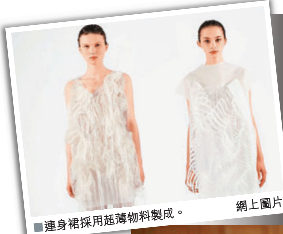
連身裙採用超薄物料製成。