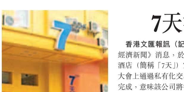
7天連鎖酒店廣州分店。資料圖片

長建發言人回應指，與澳洲稅務局之稅務爭議已持續數年，並於長建及電能的2012年中期報告及2012年年報內作出披露，自爭議發生起已尋求法律意見，並一直認為長建及電能就該索償作出成功抗辯的機會頗高，又反駁澳洲稅務局針對長建及電能的直接指控均毫無根據，兩家公司將積極抗辯，捍衛本身立場。