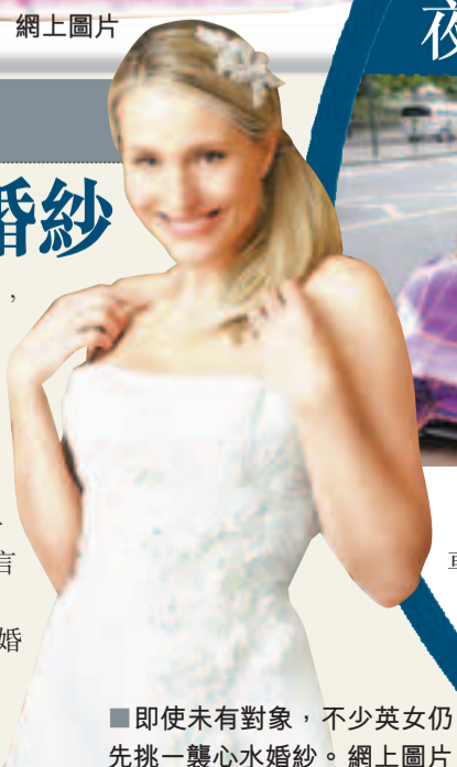
即使未有對象，不少英女仍先挑一襲心水婚紗。