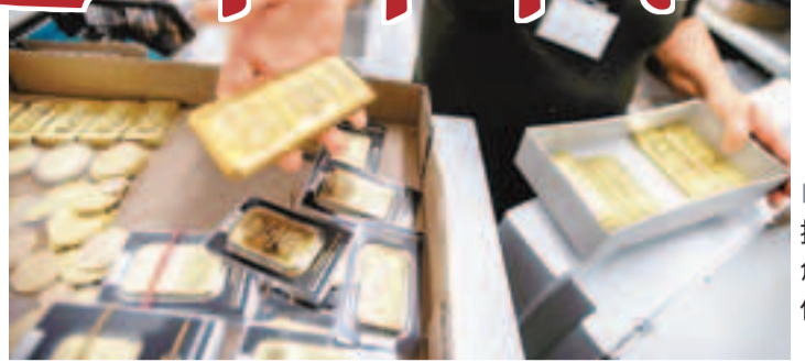
黃金持續捱沽，價格創近3年新低。資料圖片