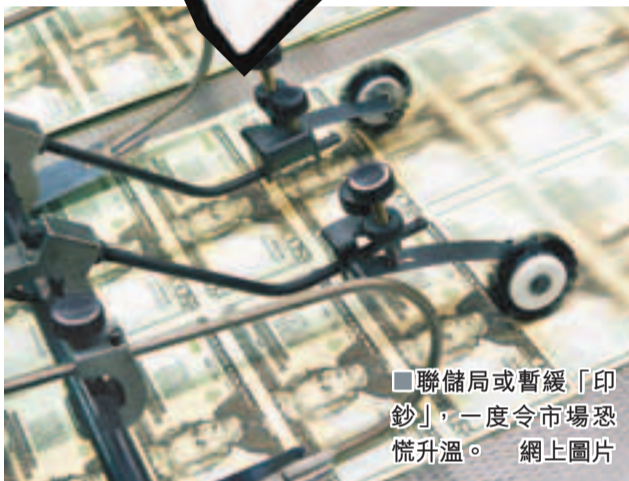
聯儲局或暫緩「印鈔」，一度令市場恐慌升溫。