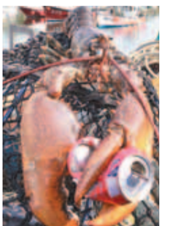
這隻60歲龍蝦寶刀不老，一箱已把汽水罐弄扁。

英國萊姆灣漁民日前出海時有意外收穫，撈到一隻2.5呎長深海大龍蝦，估計最少有60歲。由於龍蝦身型龐大，難落鍋烹調，被送往水族館展出，9月會放生大海。