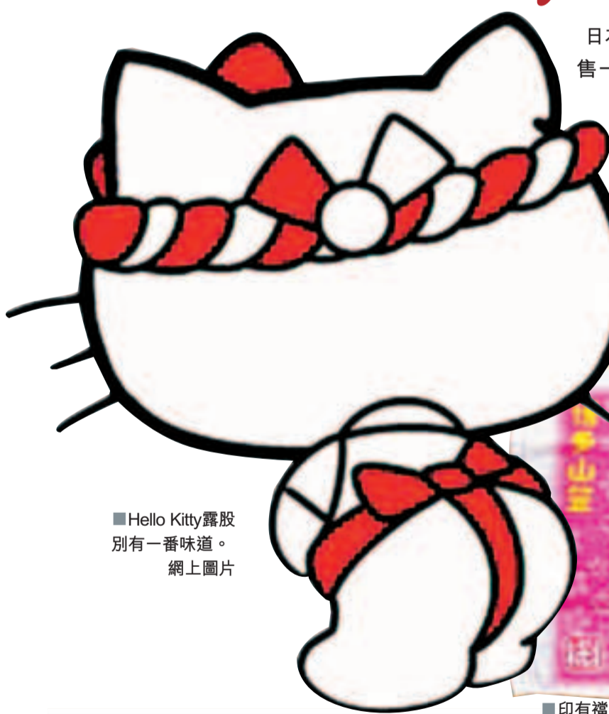
Hello Kitty露股別有一番味道。

日本卡通Hello Kitty銷售代理「Asunaro舍」公司下月推出一款特色毛巾，配合九州夏日傳統活動「博多祇園山笠」，Kitty穿上兜襠布露出圓圓屁股扮壯男，幾乎「全部走光」。外界對設計褒貶不一，有人覺得其露股背影很可愛，亦有人批評這根本不符合Kitty的形象，也有人覺得Kitty很無辜，呼籲「不要叫Kitty亂接工作。」