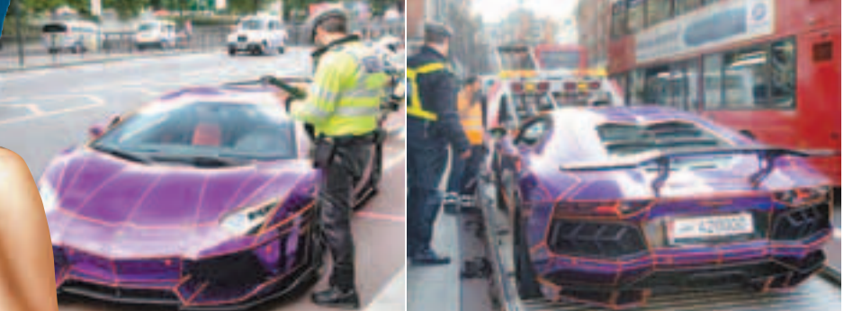
警員不但向跑車發牛肉乾，還安排了拖車拖走。