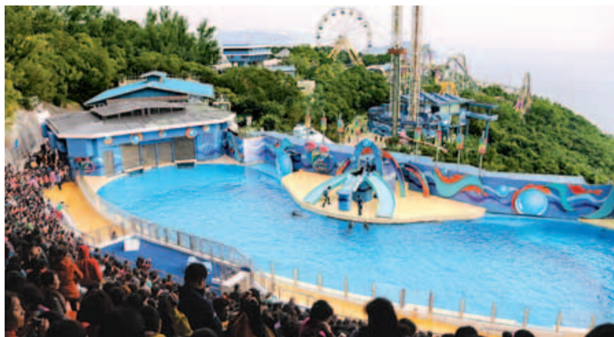
海洋公園將於9月1日起將門票價格上調，成人票價將由現時的280港元調高至320港元；小童票價則由140港元調高至160港元。圖為遊客在海園海洋劇場觀看海獅、海獅表演。

在是次票價調整過渡期間，海洋公園將會在新票價實施後首2個月，即9月和10月，香港市民購買門票可享有85折優惠。此外，在7月「夏水禮」期間，海洋公園亦推出消暑夜場、夜場優惠門票，成人票160元，小童票80元。海洋公園表示，過去兩年，多個新景點落成，包括投