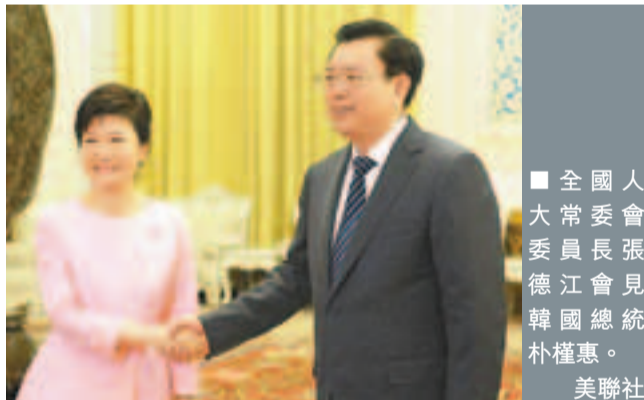
■ 全國人大常委委員長張德江會見韓國總統朴槿惠。