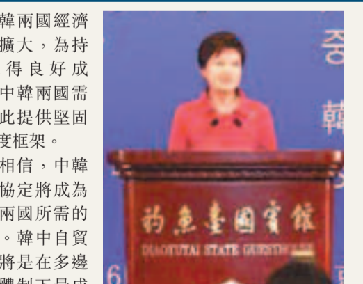
■ 朴槿惠在中韓商務合作論壇上發表開幕演講。

此外，朴槿惠指出，「有句話說，沒有人，什麼都沒法實現；但沒有制度，什麼都無法持續。」隨