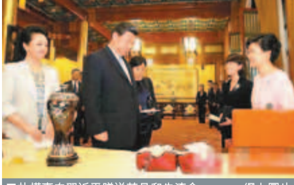
■ 朴槿惠向習近平贈送茶具和朱漆盒。