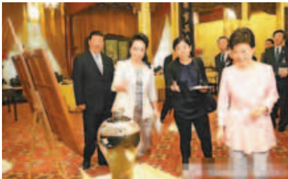
■ 彭麗媛向朴槿惠介紹習近平所贈的禮物。網上圖片