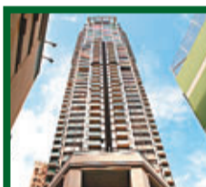
萃峯 活道28號 實用面積呎租50元