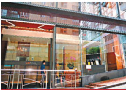
CÉ PAGE 永豐街23號 招牌菜：燒羊架、蟹腳炒飯

小區特色食肆還有於聖佛蘭士街主攻傳統法國菜的La Fleur、日式燒肉的同日日式燒肉；在月街主理西班牙菜式的Plaza Mayor、越南餐廳 MAYA CAFE；以及於光明街主理