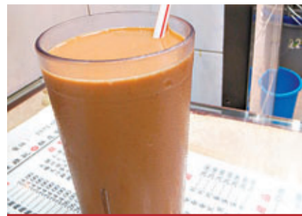
金鳳茶餐廳 春園街41號 招牌菜：凍奶茶、雞批