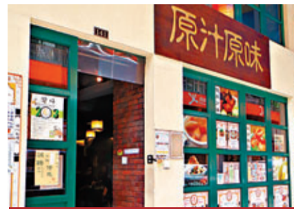
原汁原味 灣仔道141號 招牌菜：鹽焗雞、香酥魚架