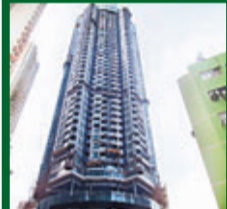
壹環 灣仔道1號 實用面積呎租52-59元