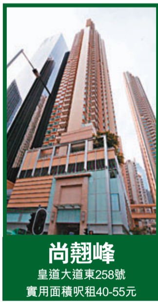
尚翹峰 皇道大道東258號 實用面積呎租40-55元

YORK PLACE外形就有如一枝文昌竹，傲然矗立於翠濠樓之中，有鶴立雞群之勢，從風水學的地形來說，灣仔中間微微突起似龜狀，維港的海水在水漲時會輕輕淹過這片高地，故為之戲水靈龜。這種地形最旺就職或退休人仕。香港的龍脈由西北落脈至東南，最著名的禮賓府相同龍脈。YORK PLACE的坐向就正好坐落於這條龍脈之上。