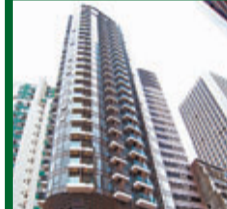
Queen's Cube 皇后大道東239號 實用面積呎租50元