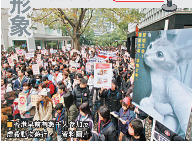
香港早前有數千人參加反虐殺動物遊行。