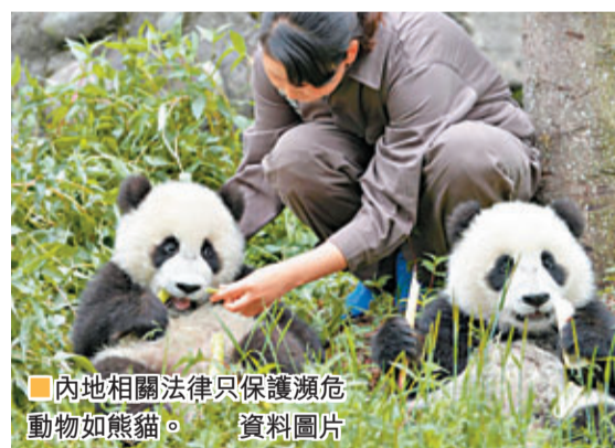
內地相關法律只保護瀕危動物如熊貓。

規定「粗」不利執法 ：內地立法一直堅持「宜『粗』不宜『細』」原則，造成法律條文多原則性條款，少具體可操作條款。如《水生野生動物保護實施