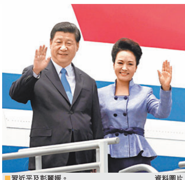
■習近平及彭麗媛。資料圖片

在國家體制上，「第一夫人」(First Lady)於行政上其實並無專職，但當陪同國家元首出訪、接見外國來賓時，她是一個國家軟實力的重要體現。在這個情況下，第一夫人既是國家元首的伴侶，也是一國女性的代表，並多參與文化、旅遊、公共服務及慈善等領域。如習近平早前外訪，彭麗媛於俄羅斯軍隊亞歷山大羅夫歌舞團舉行的音樂會上，以中俄兩文演唱俄羅斯傳統歌曲《紅梅花兒開》，以及在剛果探望遺棄兒童收容中心並擁抱孤兒等，都為外交之旅生色不少。