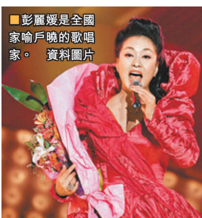
■彭麗媛是全國家喻戶曉的歌唱家。資料圖片

彭麗媛的首次亮相不僅獲得全國喝采，更引起服裝市場的熱烈回應。據《北京青年報》3月26日報道，國有品牌服裝服飾股集體上揚，其中主業分別為高端男裝和女裝製造的大揚創世與朗姿股份先後漲停。