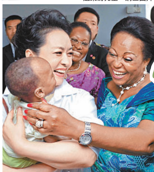
■彭麗媛在剛果探望被遺棄的兒童。