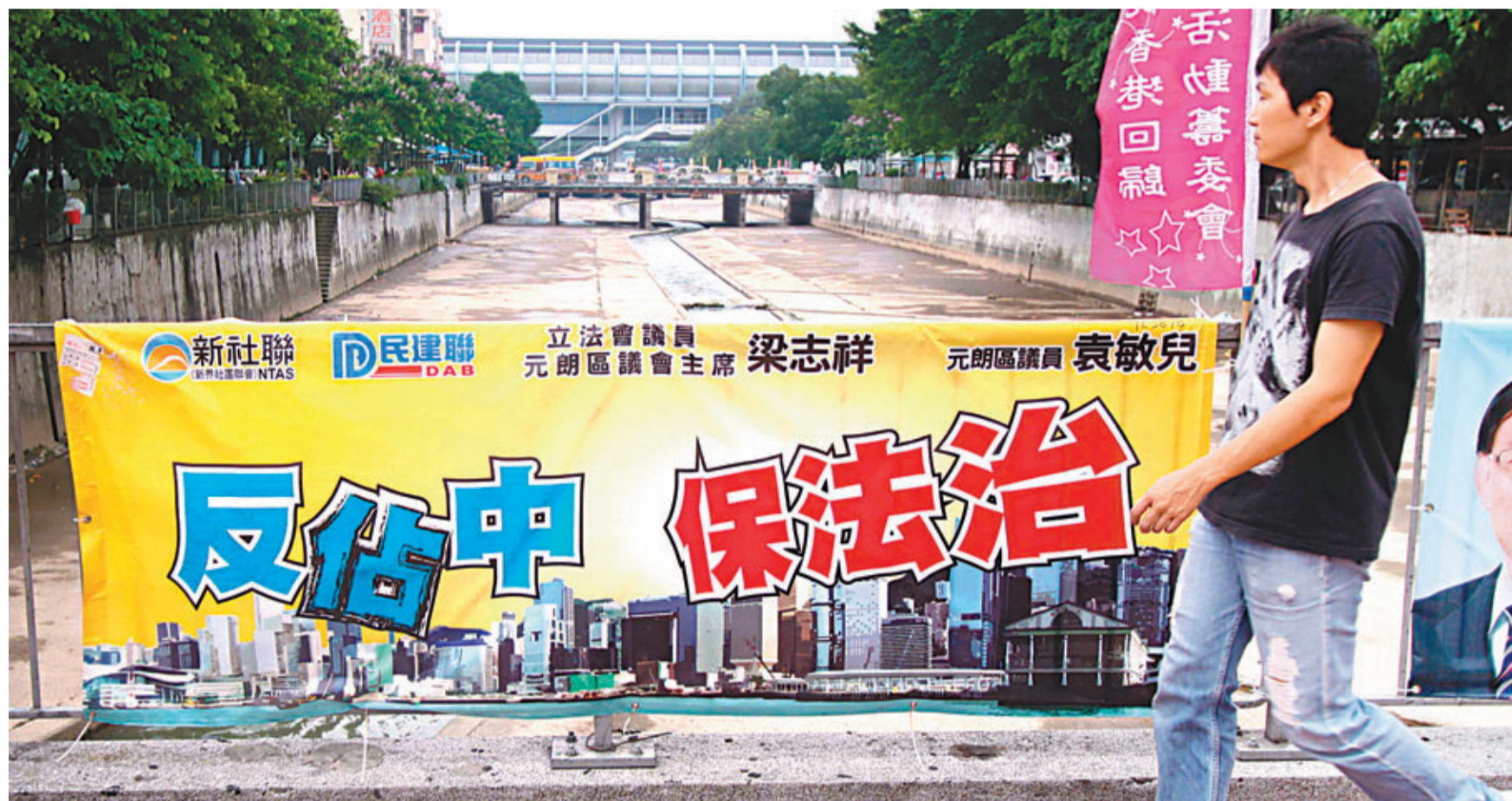
■有調查發現有88%市民表明不會參與「佔中」，顯示行動未得到大部分市民支持。圖為民建聯反「佔中」街旗。

香港文匯報訊(記者 鄭治祖)反對派鼓吹的「佔領中環」不得民心，倡議者在早前第一個「商討日」就決定到地區以至學校「播毒洗腦」。而香港研究協會昨日公布第三次「佔中」民意調查，發現有63%受訪市民不支持「佔中」，70%認為「佔中」擾亂社會秩序，兩者均較上次調查上升，並續有88%表明不會參與「佔中」。研究負責人指，調查繼續顯示大部分市民擔憂「佔中」會衝擊本港法治精神、擾亂社會秩序及損害本港經濟，顯示行動未得到大部分市民支持。