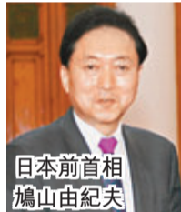
日本前首相 鳩山由紀夫

香港文匯報訊 據日本共同社報導，日本前首相鳩山由紀夫在接受香港鳳凰衛視採訪時稱，就主張對釣魚島擁有主權的中國政府，表示了理解。