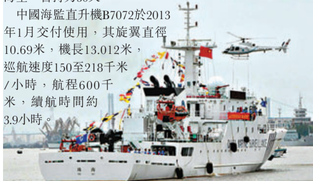
「中國海監9020」、「中國海監9030」和中國海監直升機B7072昨日正式入列。

資料顯示，這兩艘海監船船總長均為79.98米，型寬10.61米，設計排水量1,337噸，最大航速20節，續航力5,000海里，自持力30天。