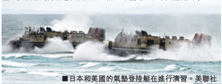
■日本和美國的氣墊登陸艇在進行演習。

對美國和日本擬於10日起在美加利福尼亞州舉行奪島聯合演習，中國外交部明確表示，中方希望有關方面以本地區的和平穩定為重，多做有利於增進政治安全互信、維護地區和平與穩定的事。