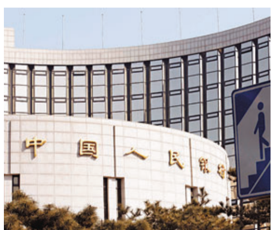
央行稱當前流動性總量並不短缺。

香港文匯報訊(記者 海巖 北京報導)昨日中國銀行間市場繼續錢荒，各大機構為搶奪資金各出奇招，一直「作壁上觀」的政府亦有所行動。中國央行昨日暫停公開市場操作，未進行91天央票及正、逆回購操作。央行並再次發文安撫市場，稱當前流動性總量並不短缺，且近日已向一些符合宏觀審慎